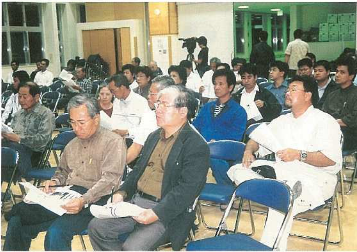
3市町の合併について考える初の住民説明会(健康福祉センター)

「考えよう やいまの未来」と題した石垣・竹富・与那国三市町の合併について考える初の住民説明会（石垣市主催）が、十一月六日夜に市健康福祉センターで開かれました。説明会では三市町の職員で構成する八重山地域合併検討会で調査・研究した「合併した場合」「合併しなかった場合」それぞれのメリット、デメリットなどが示され、参加住民との質疑応答も行なわれました。市ではあらゆる機会、場をおして各種団体や住民に対する説明を行なっていく予定です。