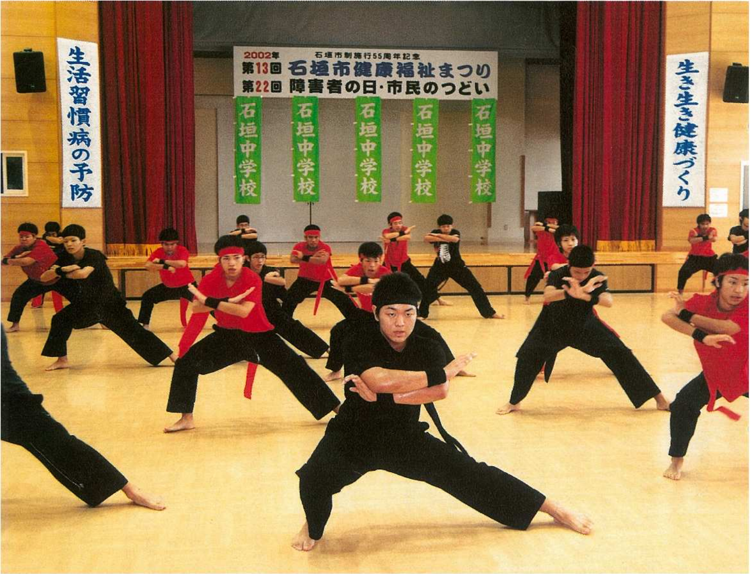
今年の健康福祉まつりで、創作ダンス「石中ソーラン」を披露する石中3年男子生徒。元気あふれる踊りが好評で、アンコールの声に応じて同日行われた障害者の日・市民のつどいの場でも披露されました。