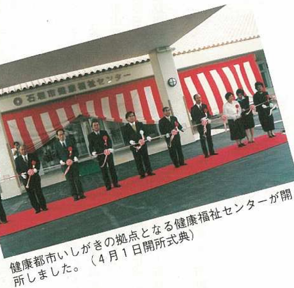
健康都市いしがきの拠点となる健康福祉センターが開所しました。(4月1日開所式典)