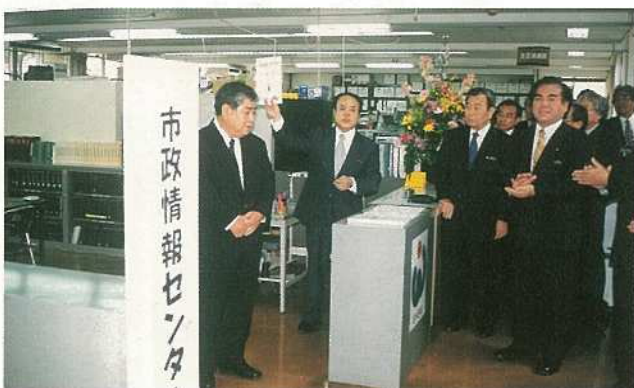
情報公開制度が4月からスタート。それに伴い総合窓口となる市政情報センターが設置されました。(4月1日看板設置式)