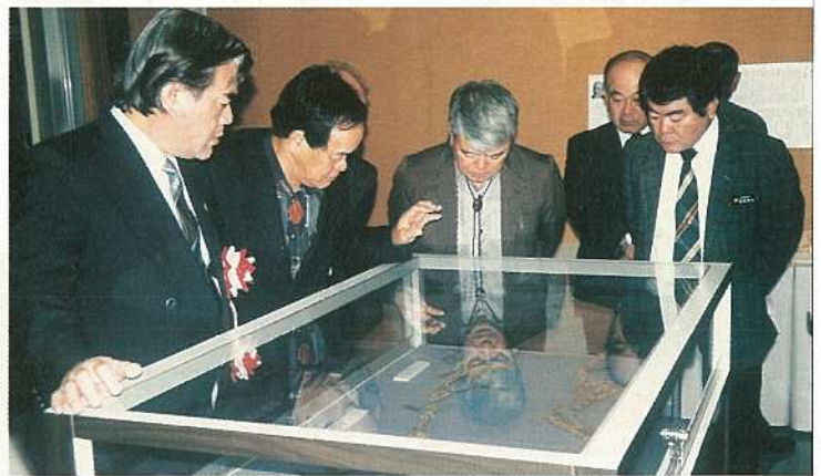
オープンセレモニー後に、バラザン(藁算)など展示物に見入る関係者

八重山人頭税廃止百年記念展(同記念事業期成会主催)が、十一月十九日から十二月一日までの期間、市立八重山博物館で開かれました。今回の記念展には東京国立博物館秘蔵の「バラザン」(藁算)の現物および古文書史料計二十点のほか、竹富島喜宝院所蔵の貴重な資料、八重山博物館所蔵の上布や御絵図帳など関係資料が展示されました。