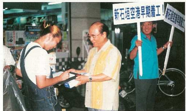
新空港の早期建設署名運動が展開され目標の3万人を達成。11月6～8日の間、東京要請行動が行われました。