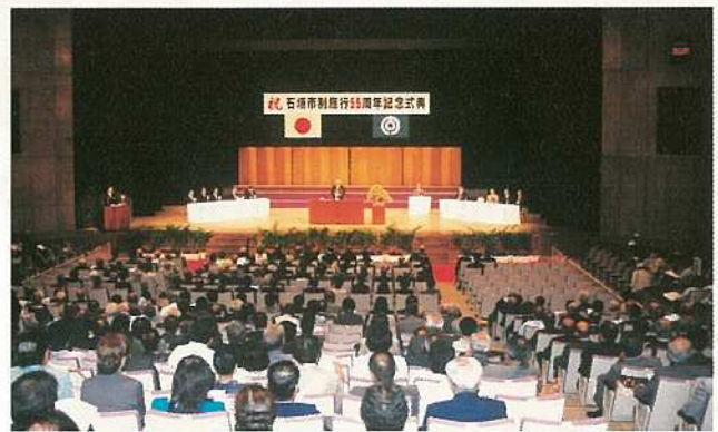
昭和22年の市制施行から55年目の節目を迎え記念式典が行われました。（7月10日）