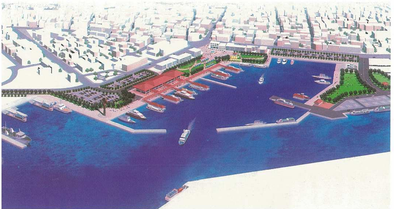
利便性が大幅に向上する登野城・美崎町地区付近バース図