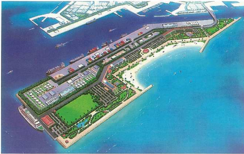
国際的な観光・リゾート拠点を形成する新港地区バース図