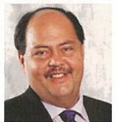
ハワイ州カウアイ市長 ブライアントJ パプティスト