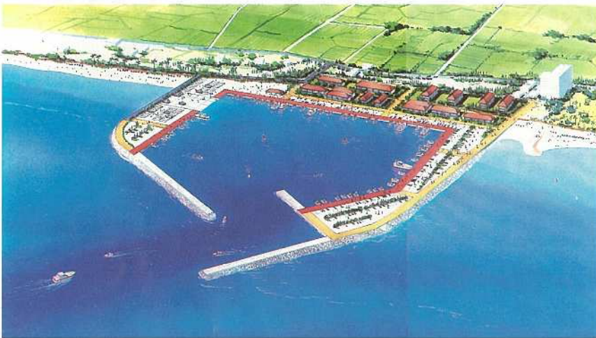
高質な小型船だまりを形成する新川地区バース図