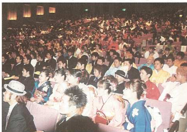
なごやかな雰囲気ですムーズに執り行われた成人式典

石垣市主催の「二〇〇三成人式」が、年明けの一月四日に市民会館大ホールで開催されました。今年から新成人への案内状を出さず