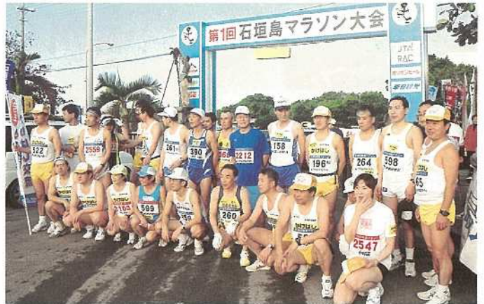
岩手から大勢のランナーが参加。マラソン交流の輪が広がりました。