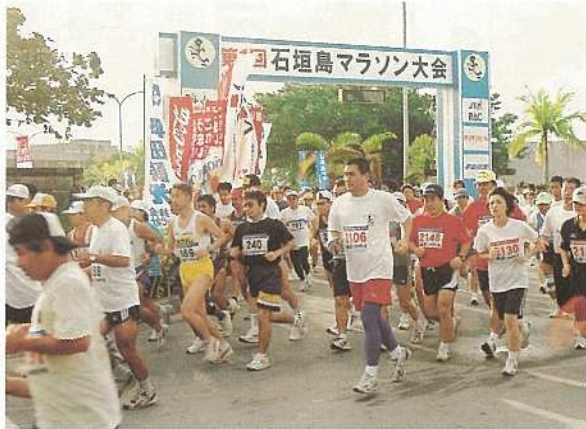
午前9時の号砲を合図に一斉にスタートをきる参加者