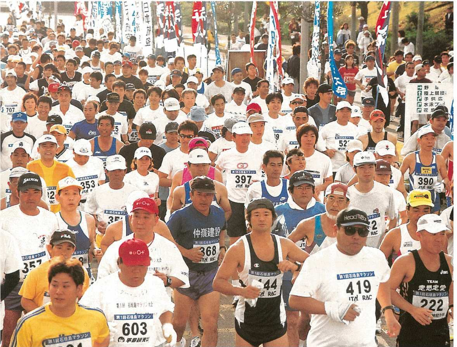
ハーフ、フルマラソンの部に総勢1,028人が出場、821人が見事に完走を果たした第1回石垣島マラソン大会