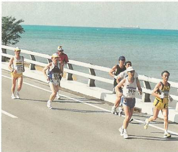
美しい自然を満喫しながら走るランナー(名蔵橋)