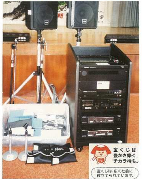
宝くじは豊かさ楽しくカラ持ち。宝くじは、広く社会に役立てられています。

石垣市では財団法人・自治総合センターが行なう宝くじ助成事業（一般コミュニティ助成事業）を導入しています。平成十四年度は、川平自治公民館の音響機材購入費とし