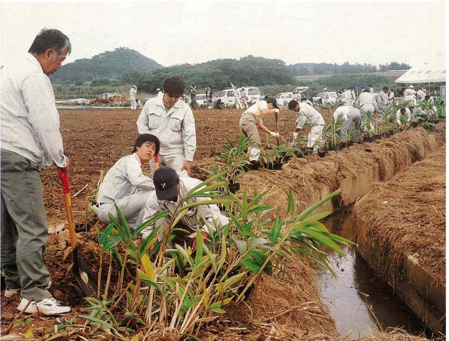
宮良仲田原に設けられたデモほ場で、赤土流出防止のためゲットウ（月桃）の植え付け作業に精を出す参加者。側溝沿い約百メートル四百本が丁寧に植栽されました。