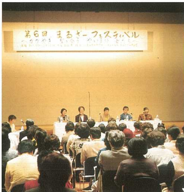
パネリストの体験談話や男女共同参画社会を考えた女性フォーラム