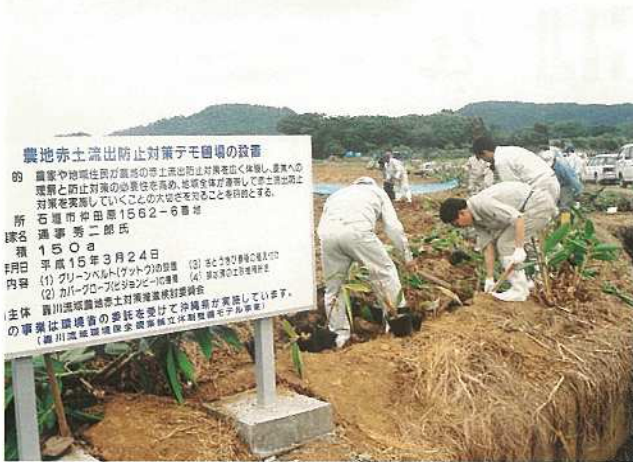
農地赤土流出防止対策デモほ場の設置 9 農業者や地味住民が農地の赤土流出防止対策を広く体制し、農地への 規制と防止対策の必要性を高め、地味を体得して赤土流出防止 対策を実施していくことの本質を明らかにすることを目指す。 所 石垣市 石垣1562-6番地 指導者 秀二郎氏 稼名 150a 月日 平成15年3月24日 内容 (1) グリーンベルト(フットウ)の設置 (2) 赤土流出防止対策の (2) カラープロ-アスファルト舗装 (4) 赤土流出防止対策 (2) カラープロ-アスファルト舗装 主体 石垣市農地赤土対策推進検討委員会 の事業は環境省の委託を受けて沖縄県が実施しています。 (石垣市農地赤土対策推進検討委員会事務局)