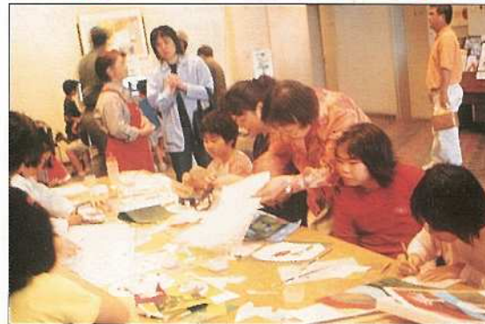
多くの家族連れでにぎわう生涯学習フェスティバル

「まなびづくり 人づくり ゆばなうれ まちづくり」をテーマにした、石垣市生涯学習フェスティバルが三月十六日に市民会館中ホールを主会場に開かれました。今年十一月より十二月に沖縄コンベンションセンターで開催される第十五回全国生涯学習フェスティバルのプレイベントとして開かれたもの。生涯学習にかかわりのある趣味のクラブやレクリエーション団体などが一堂に会して、その活動を