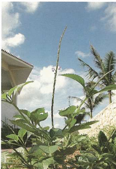
(あまちゃずる) 効能は不眠症、体力回復・白髪が黒髪になる