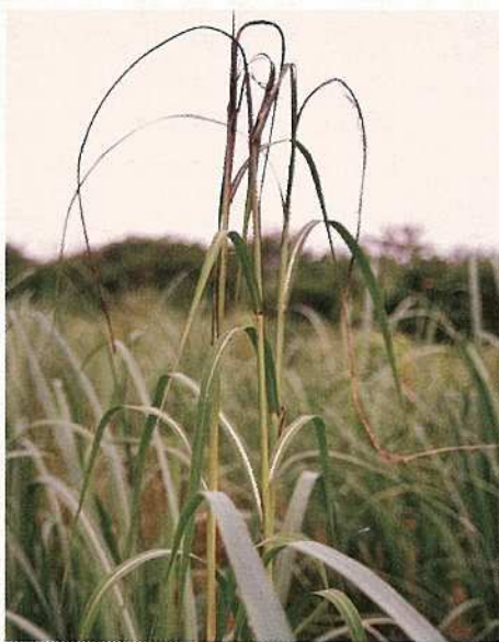
写真は、黒穂の胞子が発生したサトウキビ。(農林9号)通常の約2分の1ほどの細さになっている。