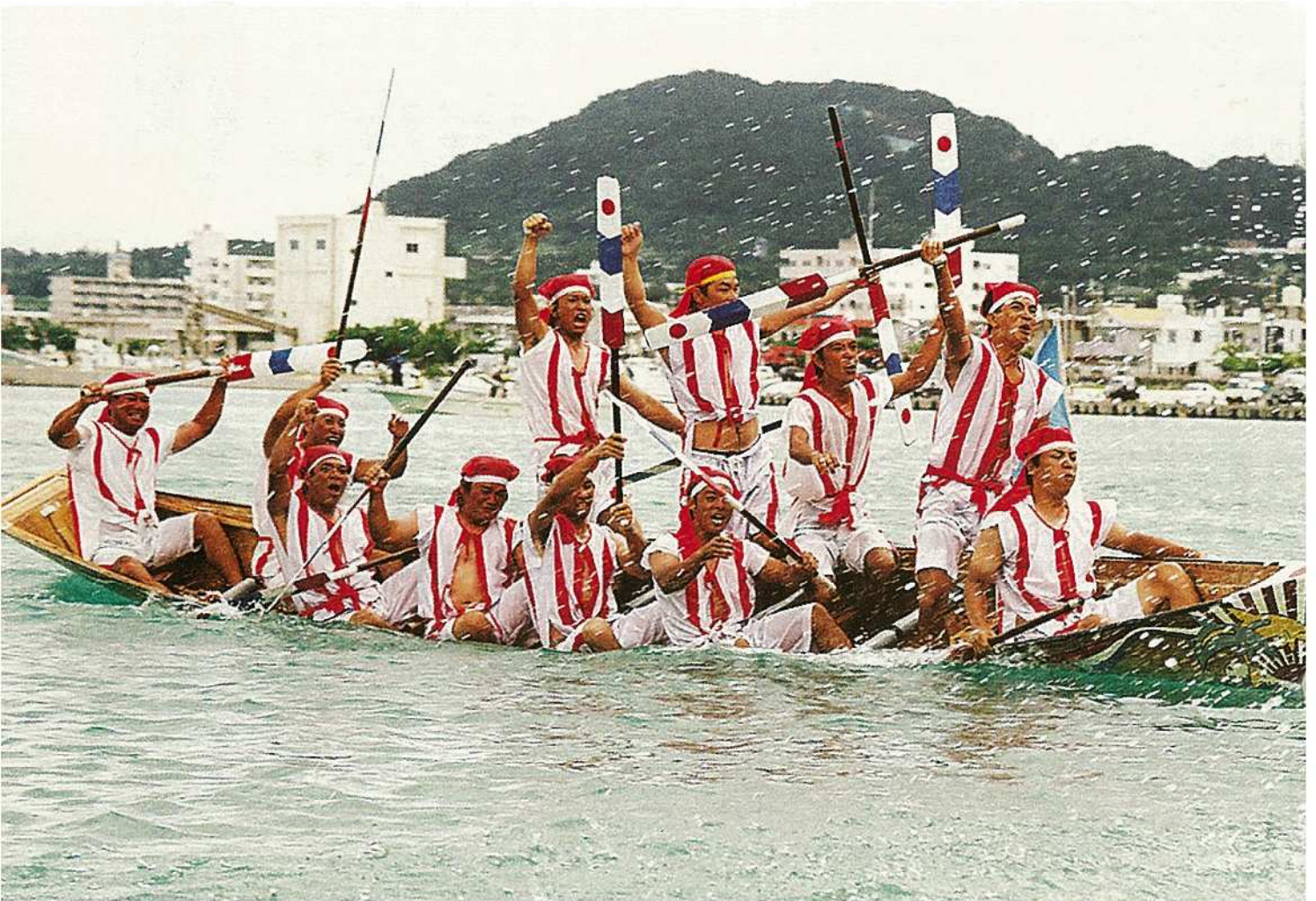
上りハーリーを制し、喜びいっぱいの東1組の漕ぎ手達。東1組は総合優勝を果たした。