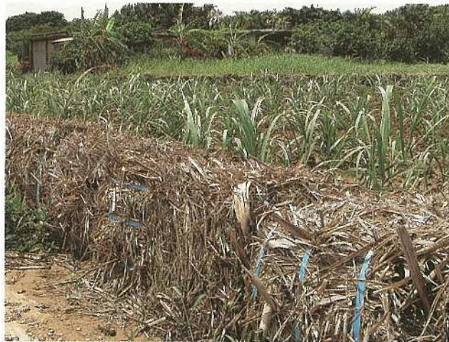
〈梱包葉柄（宮良仲田原）〉 大雨のあと、道路沿いに流れてきた赤土が堆積しているが、葉柄を設置した農地からの赤土の流出はみられなかった。

ヘクタール、サトウキビの葉殻を利用したグリーンアツプルほ場への敷草マルチ五ヘクタールが実施されています。