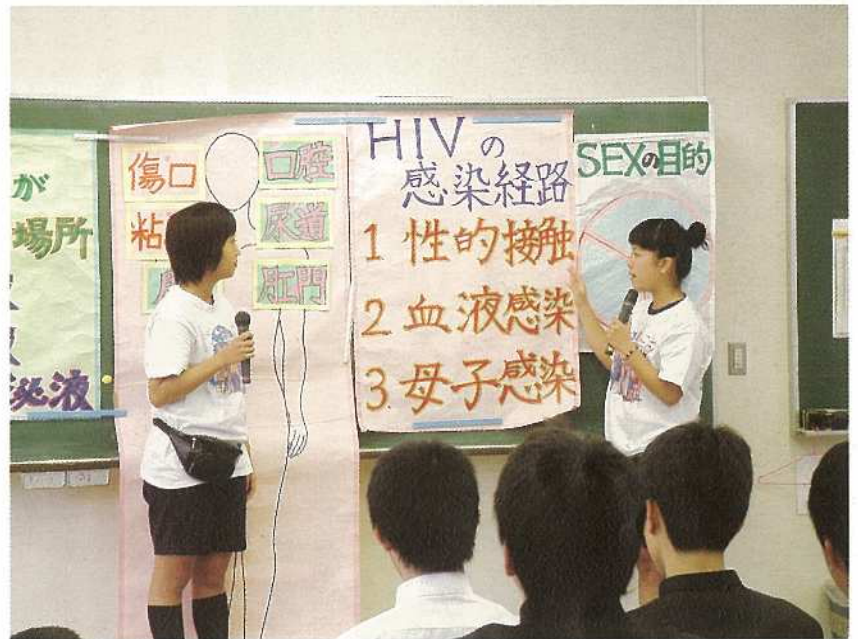
八重山商工 ピア・学習

自らの問題や社会の課題に積極的に取り組むことができる実行力のある児童生徒を育成するため、感染予防や差別・偏見に関する適切な指導を推進し、正しいエイズ教育（性教育）を進めていくことが極めて重要な課題です。 エイズ予防は「教育はワクチン」と言われるように、エイズに対して正しい知識を持ち、適切な注意を払って行動