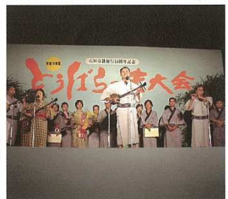
平成14年度とぅばら一ま大会の様子