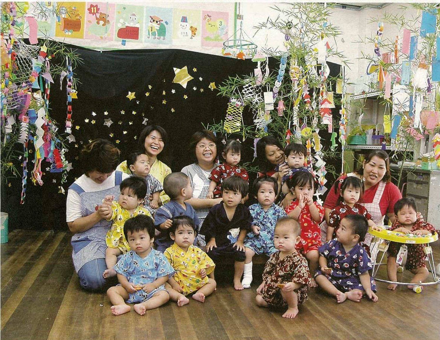
七夕まつり。きれいに飾り付けられた笹の周りでハイ、チーズ！（登野城保育所）