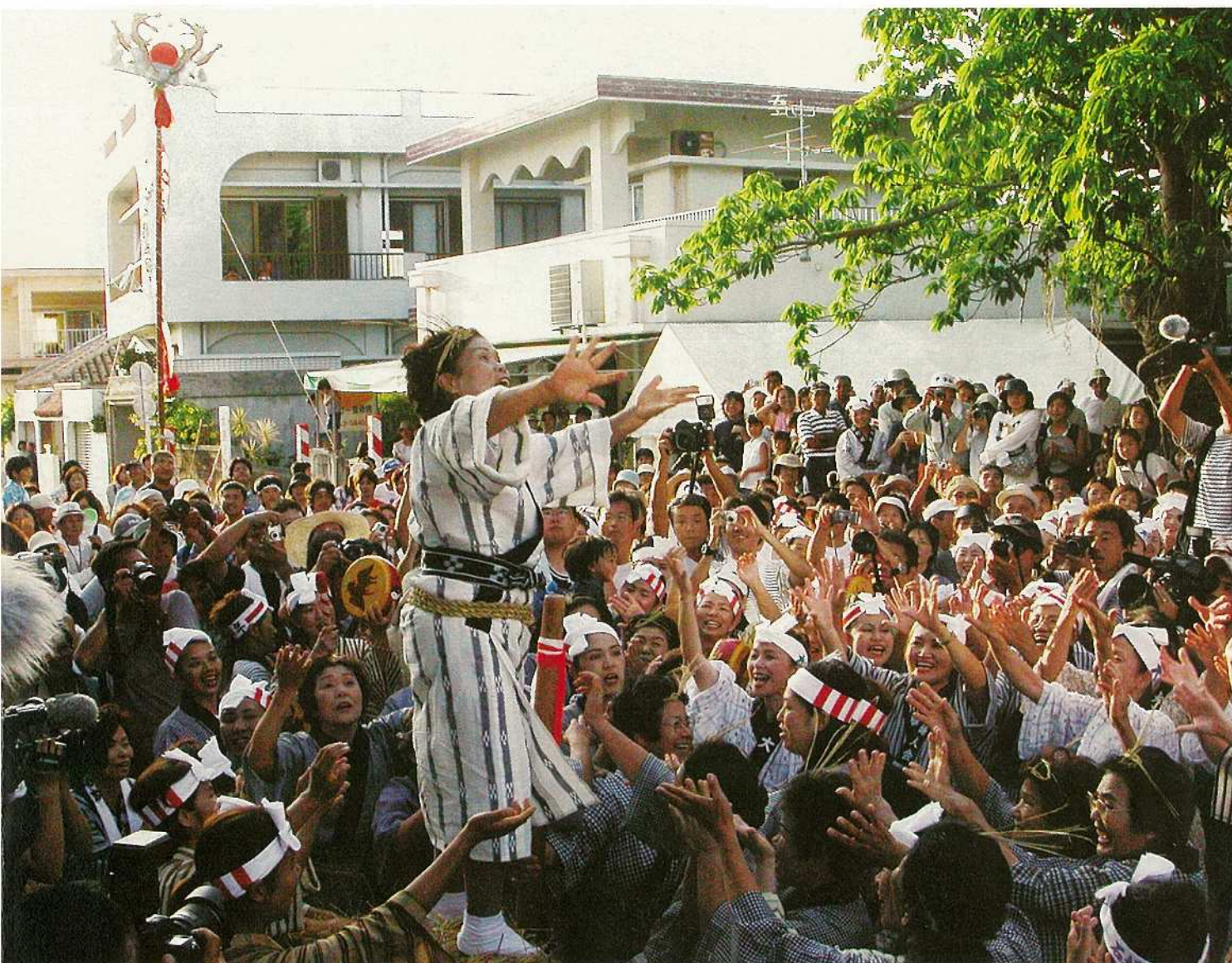
網の上のブルピトゥを囲み「サーサー」とガール女性たち。 伝統のアヒャー網は女性たちのみが雄雌の網を東西から寄せてカヌチ棒を差し込む儀式。(四ヶ字村プール)