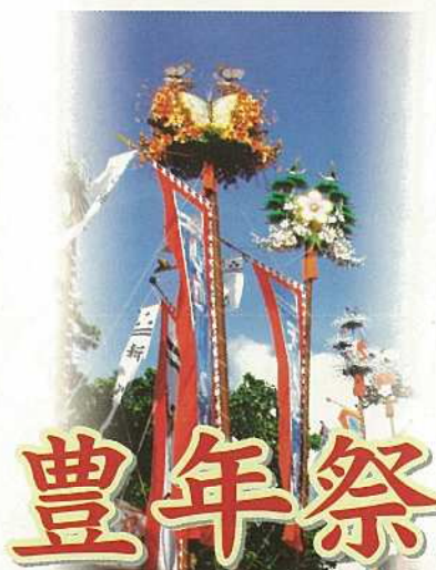
豊年祭 各地で盛大に行われる