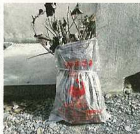
袋に入れてしぼる