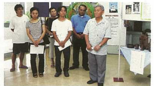
展示に際しての市役所ロビーでのセレモニー

また、同展示終了後には、 合同の展示会や即売会も計画 されており、窯業の地力向上 を図っていきます。 お問合せは商工課・地域振興 室まで。