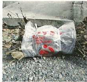
袋で包んでしぼる