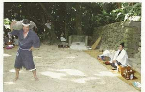
「エイッ」のかけ声でピツチュル石を担ぎ上げる。(川平)