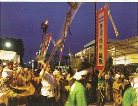
一斉にガーリを行う。興奮は最高潮へ(平得)