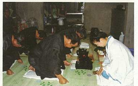
ミシャグパーシー(四ケ字)