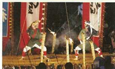
ツナヌミン(四ケ字ムラプール)