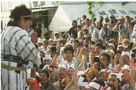
カヌチ棒を雄雌の綱に差し終え、マイツパオンに向い感謝を捧げる(四ケ字)

盛大に行われました。新川の真乙姥御嶽境内では、巻き踊りや太鼓などが奉納され、五穀種子授けの儀、女性達によるアヒャー綱で会場のムードは最高潮に。場所を御嶽西側の水元の神前に移してのツナヌミン、十数年ぶりに東側の勝利に終わった大綱引きが行われました。多くの観衆の熱気で暑い夏をさらに熱くする祭りとなりました。