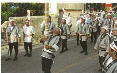
力強く旗頭を持ち上げる(四ケ字ムラプール)