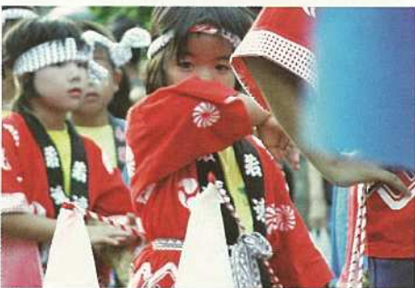
「稲の一生」パレードでちょっとお疲れ？(白保)