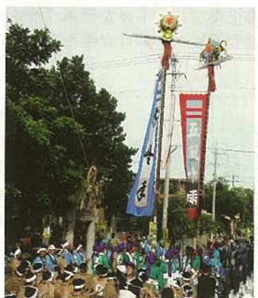
勇壮に掲げられる旗頭。迫力満点！(白保)