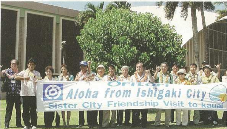
成長したミロの木の前で「アロハ」。

ちとの交流を深めてくれました。四日目は、いよいよ姉妹都市のカウアイ郡への移動となりました。カウアイ島は、ホノルル市のあるオアフ島のすぐ隣で、石垣島から宮古島までの距離ぐらいいです。大変近い距離にあり、ホノル