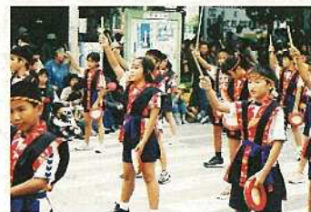
昨年の市民大パレードの様子。今年も楽しい踊りなどが期待されます。