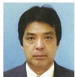
坂名城 安 教 大川162 ☎82-1603