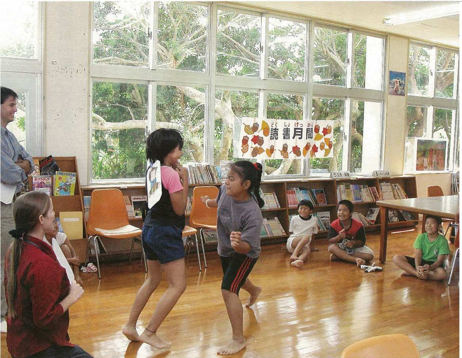
CIR（国際交流員）・ALT（外国語指導助手）の英語の授業。ゲームなどを交え、外国語にふれていきます。崎枝小学校の生徒たちも楽しみながら「ナマの英語」を学びました。