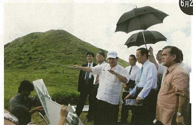
細田沖繩担当大臣が新空港建設予定地を視察。今年には多くの政府関係者が新空港予定地や赤土の状況を視察に訪れた。