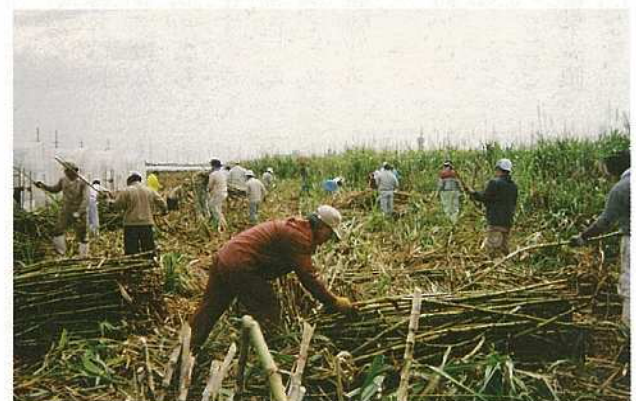
今年もサトウキビが豊作。石垣市の基幹農作物として今後も大きな期待がされる。