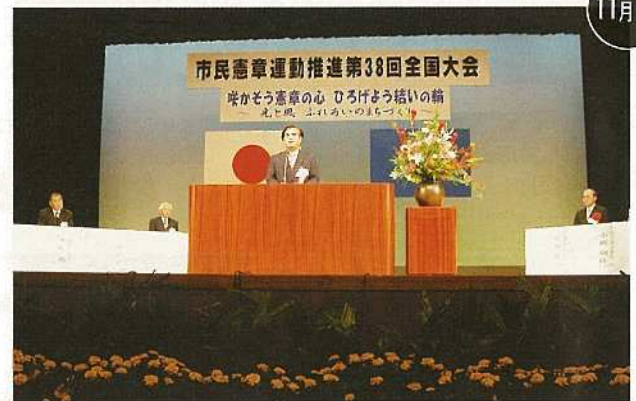
全国から大勢のまちづくり活動家が集い、市民憲章運動推進全国大会が石垣島まつり・八重山の産業まつりと同時開催された。