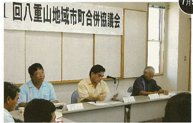
第1回八重山地域市町合併協議会(法定)が開催。3市町による合併論議が本格化。