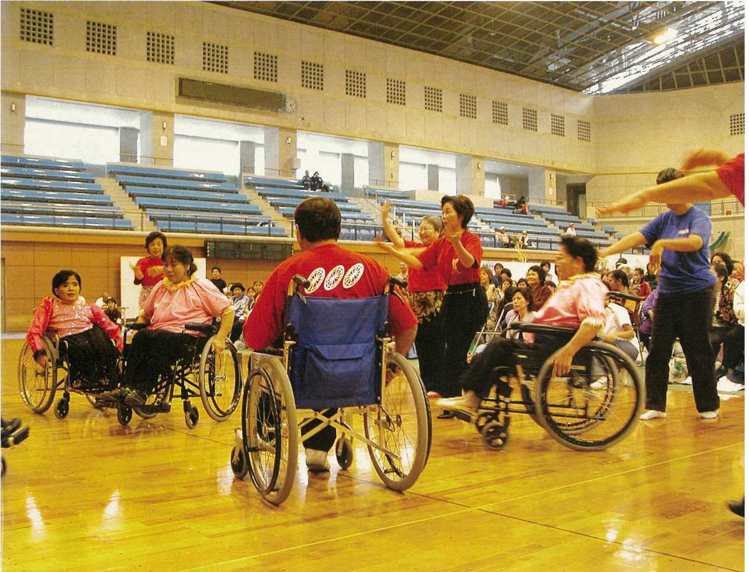
12月7日、健康福祉まつり・障害者の日市民のつどいで軽やかに車いすダンスを披露したウィルの会「ナディアいしがき」の皆さん。日頃の練習の成果を存分に発揮し、会場を訪れた市民を魅了しました。(総合体育館)