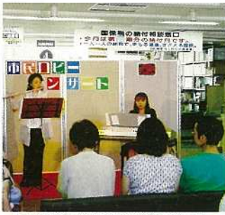
市では多くの参加者を募集中。