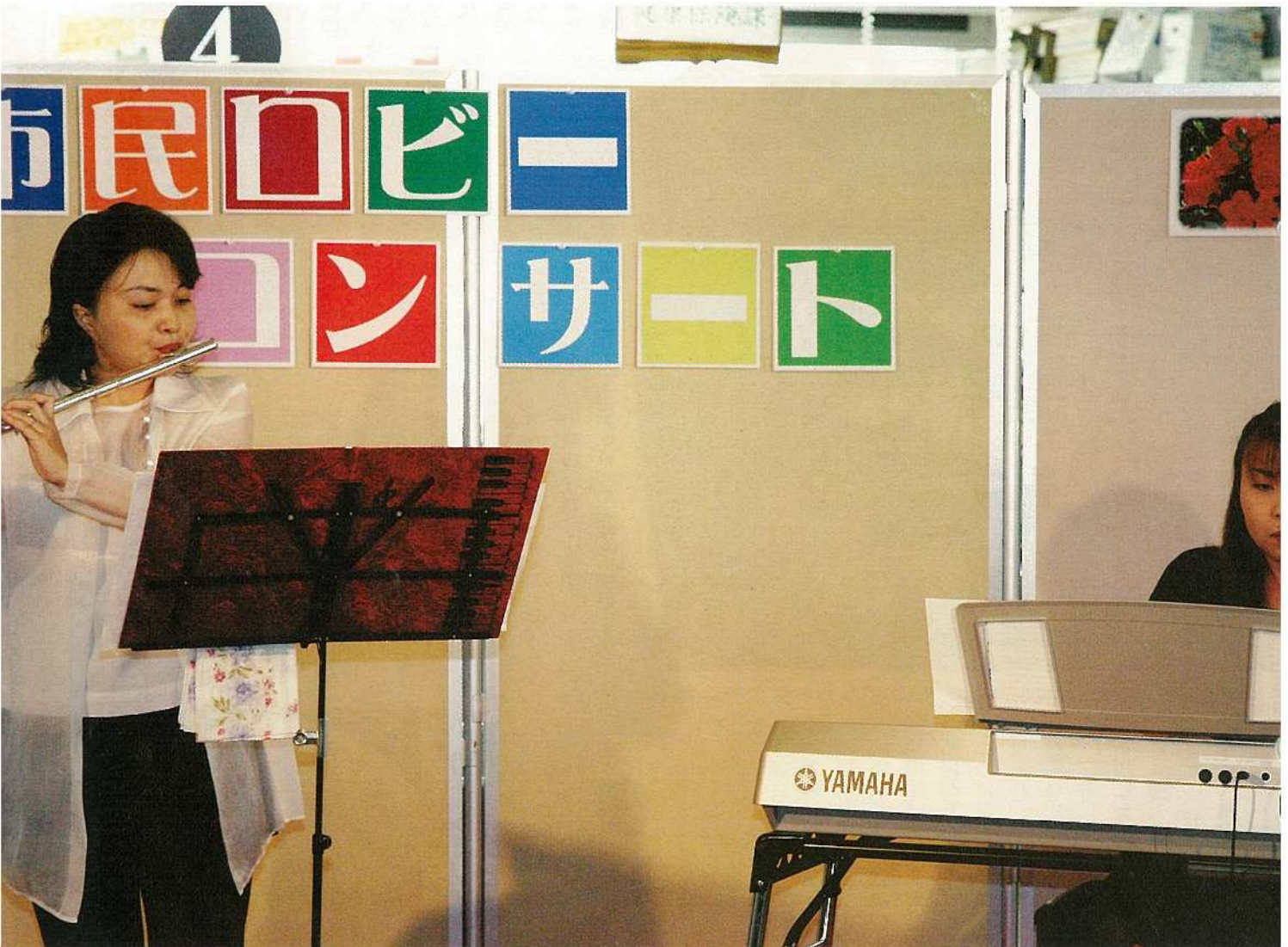
「市民ロビーコンサート」が5月26日に開催されました。お昼時の市役所庁舎内は、柔らかな音色に包まれ、来庁者を魅了しました。（市役所1階ロビー）