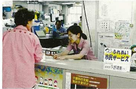
市役所玄関で市民と直接ふれあう。

す。市役所にお立ち寄りの際には、お気軽に声をおかけください。 （実施時間）午前八時三〇分～午後二時