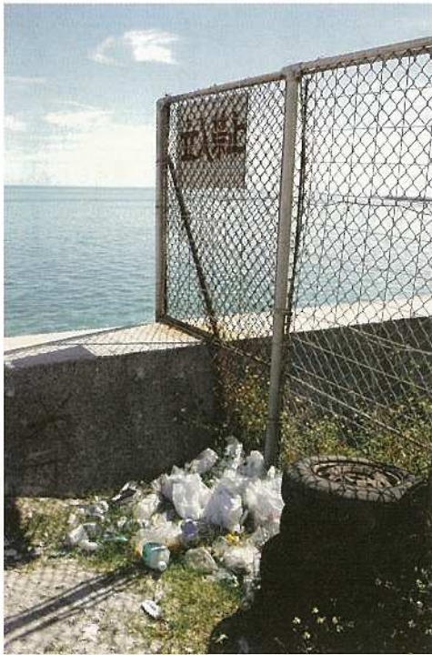
← 八島町新港地区の防波堤脇に捨てられたごみ。美しい海とは対照的に、あまりにひどい光景だ。