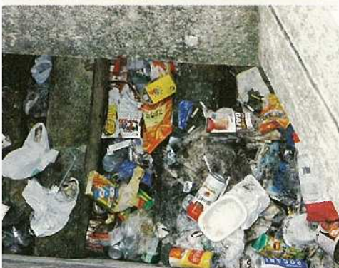
← ありのままのデトロボットでは、同じような状態だ。