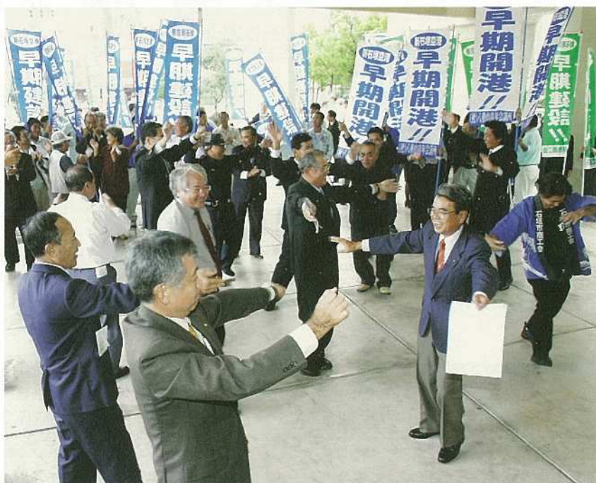
12月20日に財務省予算案に新石垣空港建設事業が盛り込まれ、市役所玄関前では多くの関係者が集まり、事実上の事業化決定を祝った。

選手が石垣島で強化合宿を行い、全国的な話題の多い一年でした。十二月には天文台建設整備が市議会で承認され、この石垣島が宇宙に最も近い島として、更に全国から注目を浴びていきます。そして、なんとと言っても新石垣空港建設事業の予