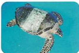
雌ガメB:今年初めて卵を産みました。甲長82.4cm、体重61.8kg。平成14年1月にセンターにやってきました。センターで飼育しているタイマイで一番大きな個体です。