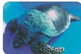
雌ガメA:甲長76.7cm、体重59.0kg。昨年に続いて卵を産み、今年は563個の卵を産みました。平成11年からセンターで5年間飼育されています。