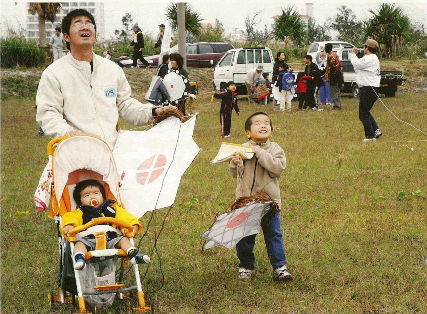
1月9日、新春たこあげ大会が開催されました。会場となった八島町新港地区には、多くの家族連れが訪れ、大空に新年の夢と希望を込めてたこあげを楽しみました。