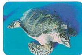
雌ガメC:甲長69.4cm、体重46.1kg。平成14年4月に下関市立水族館海響館からセンターにやってきました。他の2頭より体は小さくまだ卵を産んでいませんが、超音波診断で成熟した雌であることがわかっています。