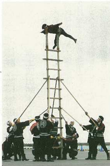
めかけた市民をわかせました。 また、婦人防火クラブによる炊き出し、写真パネル展、ミニ消防車「消ちゃん号」の試乗会などが

勞など六名に感謝状が贈られ、消防活動への協力に対し謝意が示されました。 アトラクションでは、県内唯一の「はしご乗り」が披露され、五・二メートルの高さのはしごの上で、消防団員六名が次々と多彩な演技を披露し、会場につ