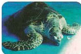
雄ガメ:甲長82.2cm、体重71.8kg。栽培漁業センターで飼育している唯一の成熟した雄ガメです。来年もたくさん卵が採れるようにがんばってほしいものです。