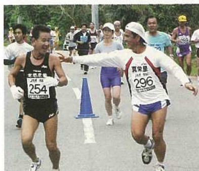
余裕たっぷりの選手達も。