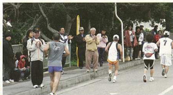
沿道の声援が選手を後押し。多くの市民が応援で大会に参加。