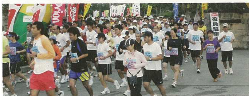
一斉にゴールを目指し総合運動公園を駆け出していく。

今大会はフルに六百六十九人、ハーフに四百七十二人、10kmに三百三十六人の計千四百七十七人の選手が参加。千二百七十七人の選手が完走し、リタイアはフルで九十五人、ハーフで六十一人、10kmで四十四人、完走率は