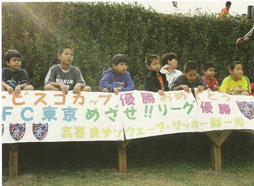
今年もJリーグFC東京が石垣島合宿を行った。国内へ石垣市のPRする効果は図り 知れず、観光客の増加の一因にもあげられる。また、周辺に見るトップレベルのプレー に、子ども達に与える影響も大きい。

文化、歴史がある島だということです。三つ目にこの 島の食文化です。第一次産業が生み出す様々な農産 物や本土でも評判の良い泡盛等を含め、食文化が繁栄 しているという事も大きな要因です。四つ目には人々 の心の温かさです。人情の島と言われるだけあり、訪