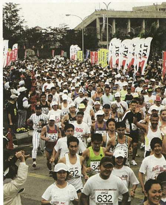
1,141人のフル・ハーフマラソンの選手達が午前9時にスタート。