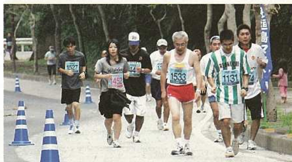
バナナ岳入口近くのきつい上り坂。必死に走る選手達。