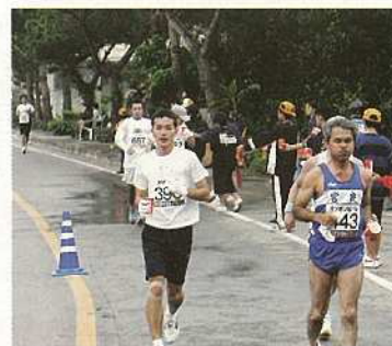
給水OK！さあ、また走るぞ！給水は完走のおおきな力。