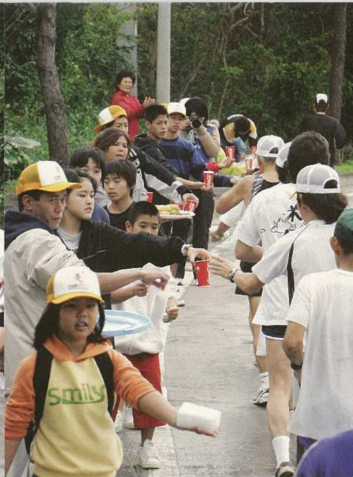
大会は、多くのボランティアの皆さんに支えられた。