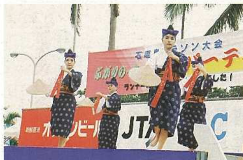
大会後の交流会では、歌や踊りなどが披露され、参加者は交流を楽しんだ。