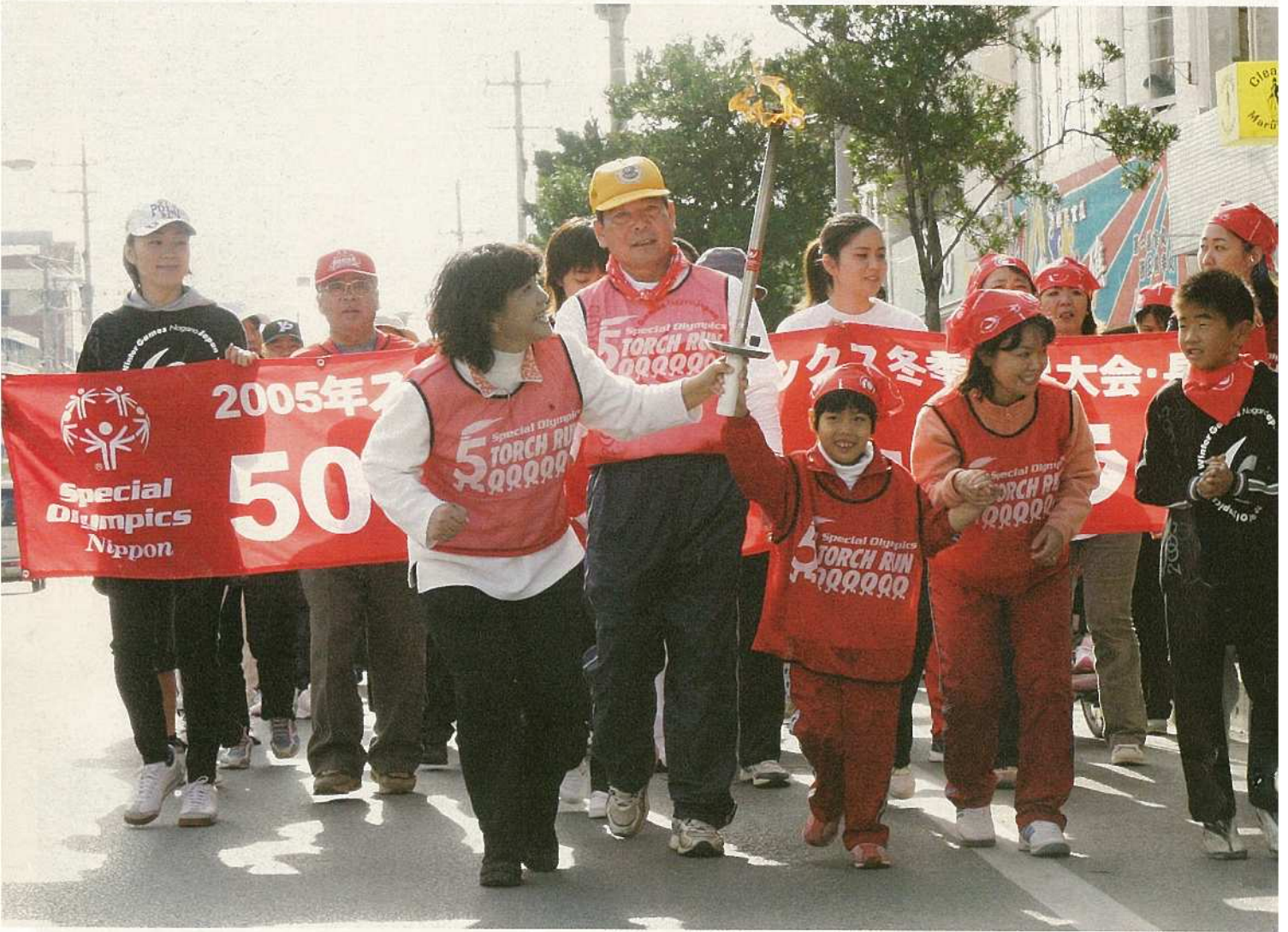
1月22日、長野スペシャルオリンピックスに向け、石垣島500万人トーチランが伴走、ボランティアなど45団体、総勢700名以上の参加のもと盛大に行われました。新栄公園を発着点に聖火リレーを行い、アスリートには知的障害者70名余が力走。一生懸命に走る姿に大勢の市民が感銘を受けました。