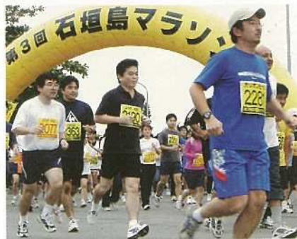
326人の参加があった10kmコース。