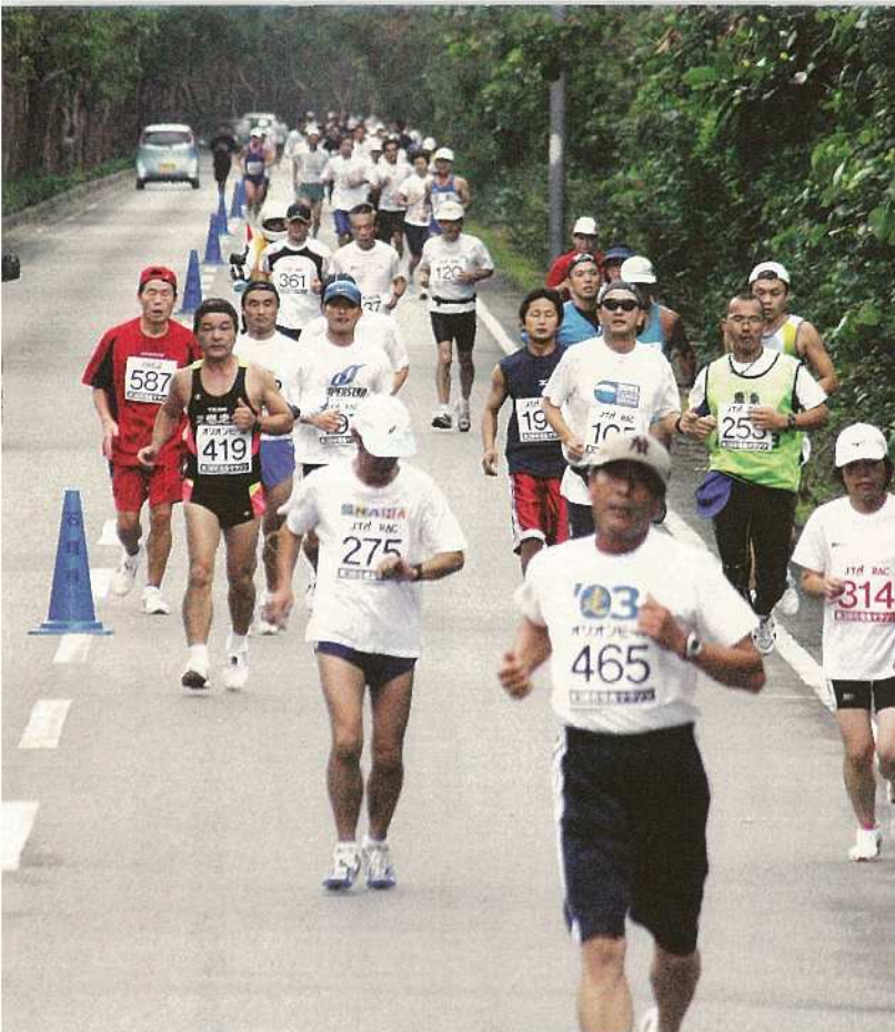
海風を受けながらマイペースでレースを楽しみ選手達。