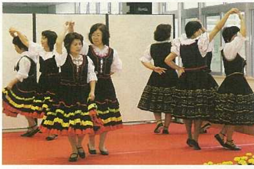
各団体が特設ステージで活動を紹介した。

今年も、青年会、竹富町の団体が加わり、過去最高の二十八団体が参加し、活動の広がりを見