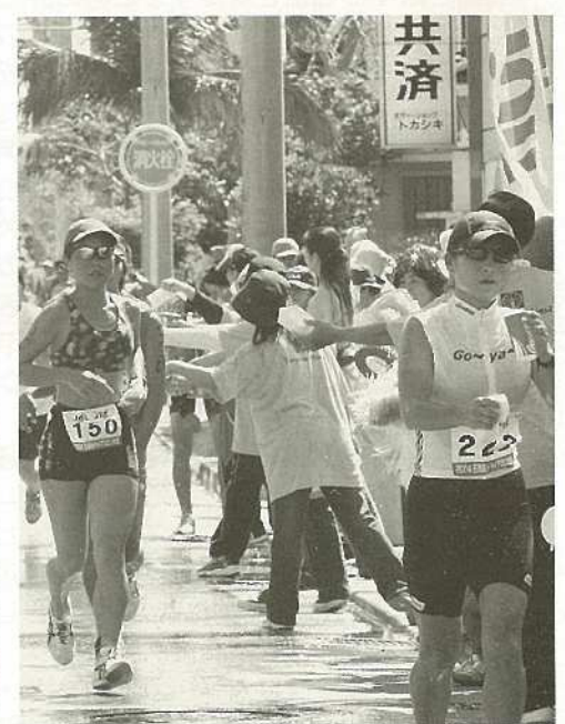
今年も熱戦が予想されるトライアスロン大会。沿道からの応援をお願いします。