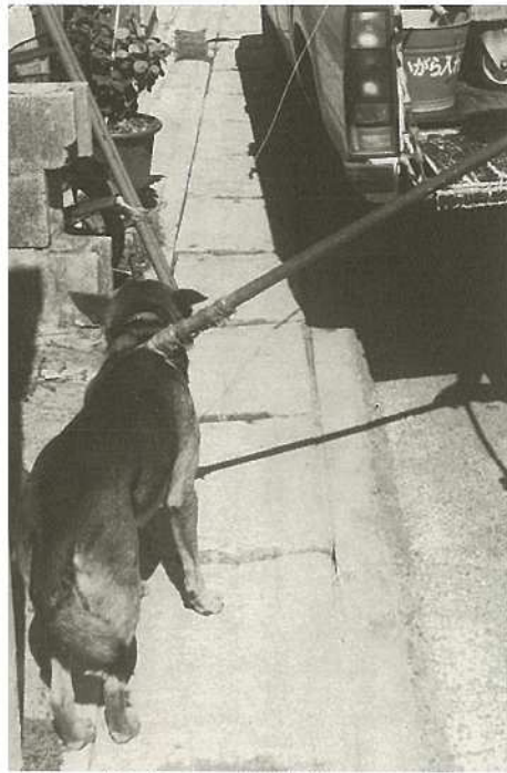
放し飼いにされ、捕獲された犬

さないようにする(特に夜間は鳴かさないようにする。無理な場合は、口輪などで対処する。)