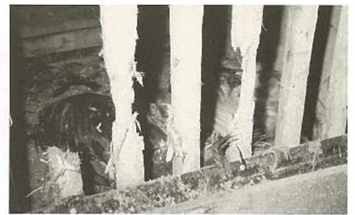
木製の柵を食いちぎり、野犬が鶏を襲った