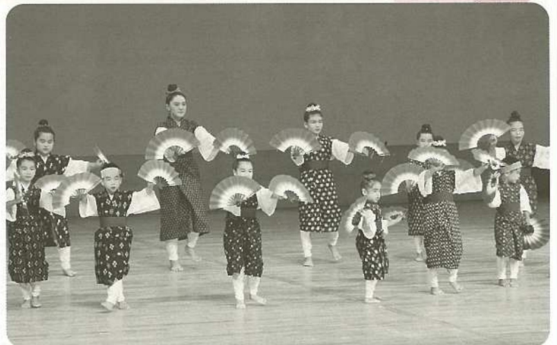
趣向を凝らした19演目が披露され、大きな声援が送られた。

会場では、子ども達の晴れ姿を一目見ようとつめかけた家族や友人などから、大きな拍手や声援が送られていました。