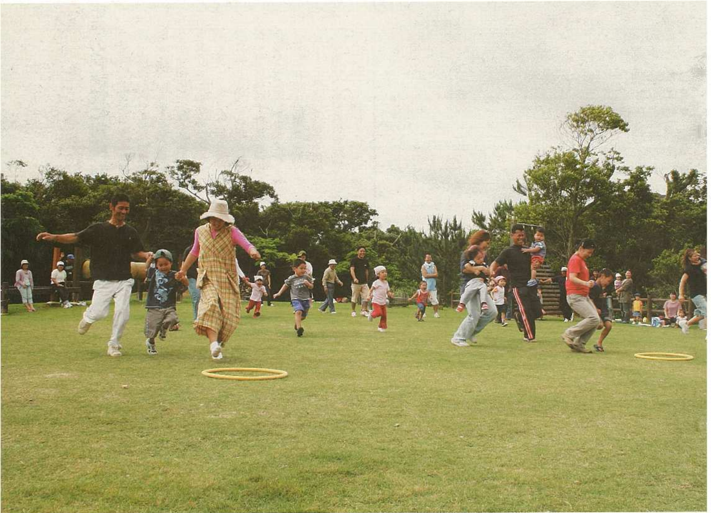
大型連休となった今年のゴールデンウィーク。市内の各地では親子でレクリエーションなどを楽しむ姿が多く見られました。市内の各保育所でも親子遠足が行われ、晴天のもと心地よい汗を流しながら休日を満喫しました。