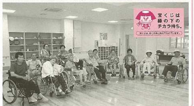
宝くじは緑の下のチカラ持ち。 JRCUM & COOPERATION CENTER