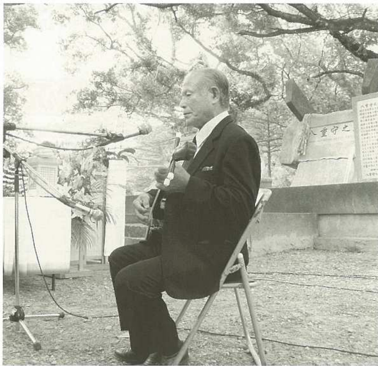
戦後60年の慰霊の日、平和祈念式で「回想とうばらーま」が想いを込め歌い上げられ、参加者の胸に強く響いた。(八重守の塔)

あたら生命(ぬつ)し換(か)やー 賜(たほ)れーる 弥勒世(みるくゆ)や 肝(きいむ)かい染(す)めーり 擁護(まむ)り 貫(とう)しようら ンゾーシヌ 幾世(いつゆ)までいん