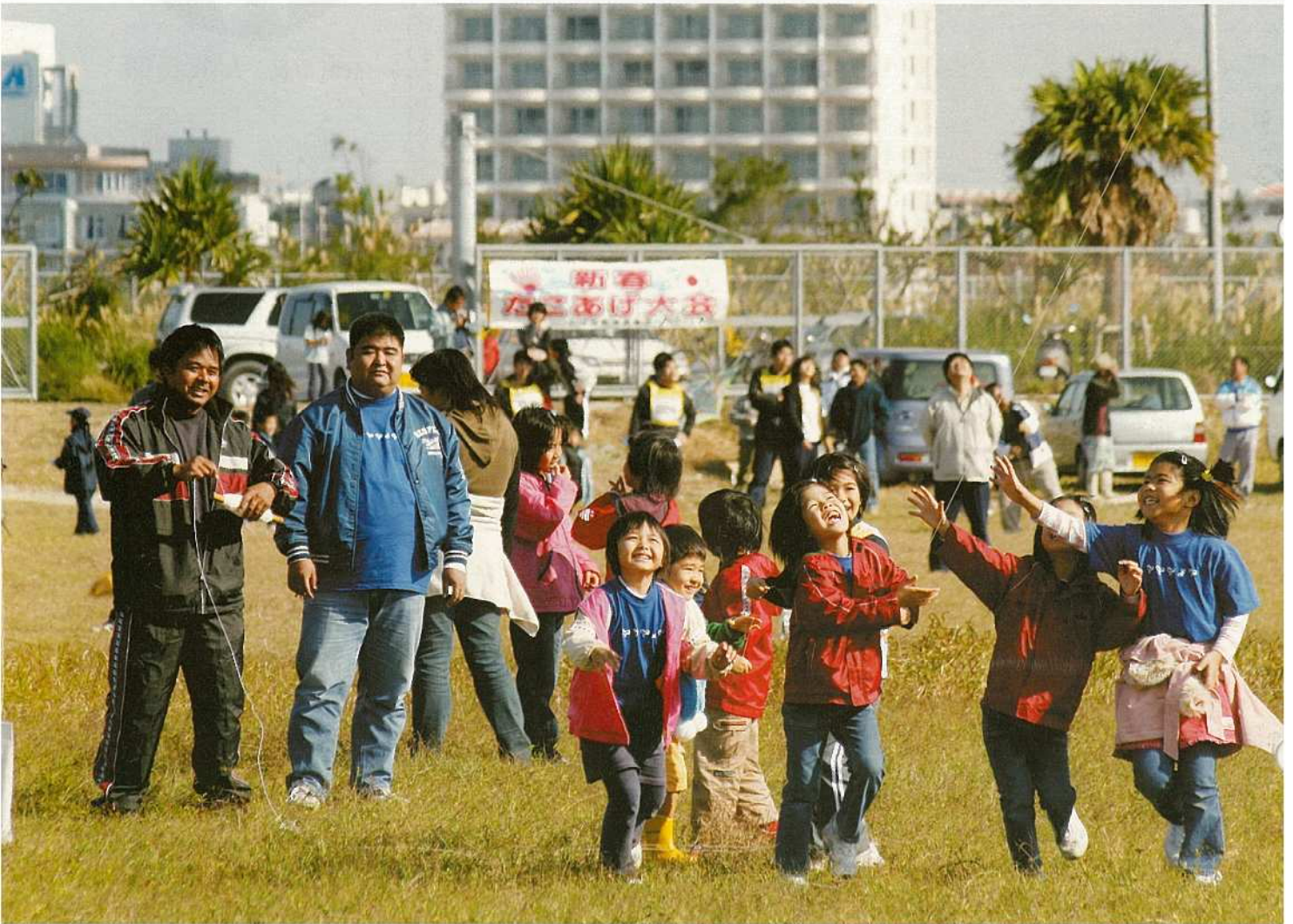
石垣市新春凧あげ大会が、1月8日に八島町新港地区で開催され、多くの親子が参加し、晴れわたる新春の大きに凧をあげました。仰角を競う伝統だこの八角、ピキダー、見た目や出来栄を競う自由だこのほか、石垣小学校の連だこなども目見えし、会場に訪れた市民を楽しませました。