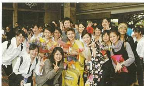
八重高カラーガード部の後輩から祝福を受ける