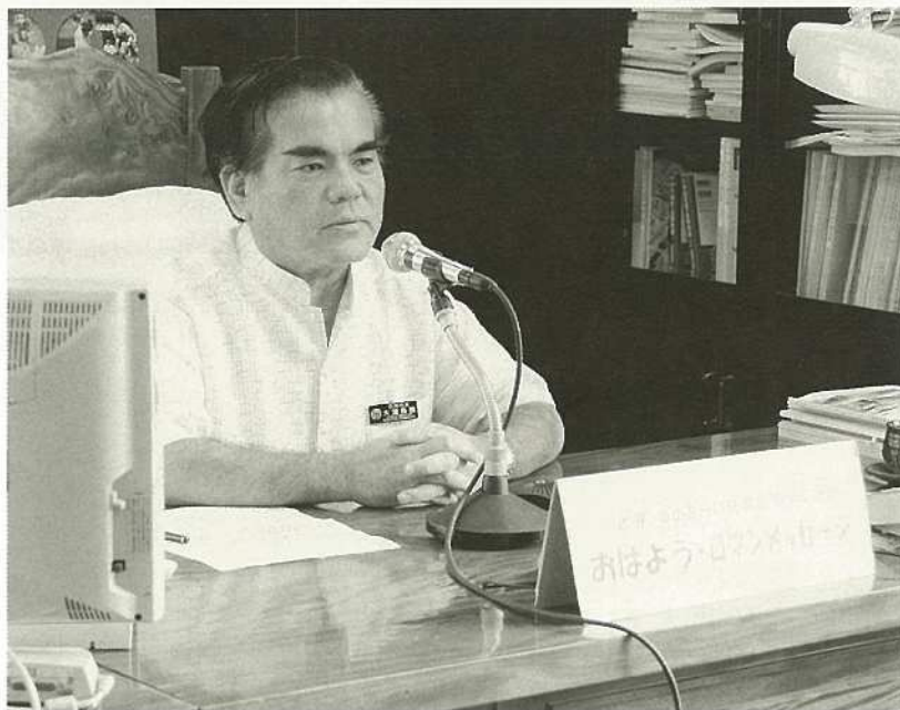
名蔵アンパルがラムサール条約に登録され、世界的にその重要性が認められた。

サール条約に登録されました。これは、私達の自然 を世界に発信する大変重要なきっかけとなります。 このアンパルをさらに環境や自然保護の大事な遺 産として継承していくことが重要であり、子ども達 にも自然を学ぶ場として、また観光客には感動を与 える場として大いに活かされていくでしょう。