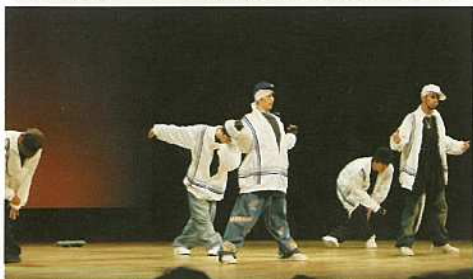
新成人によりダンスパフォーマンスが披露。