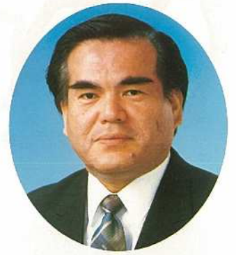
石垣市長 大瀨長照