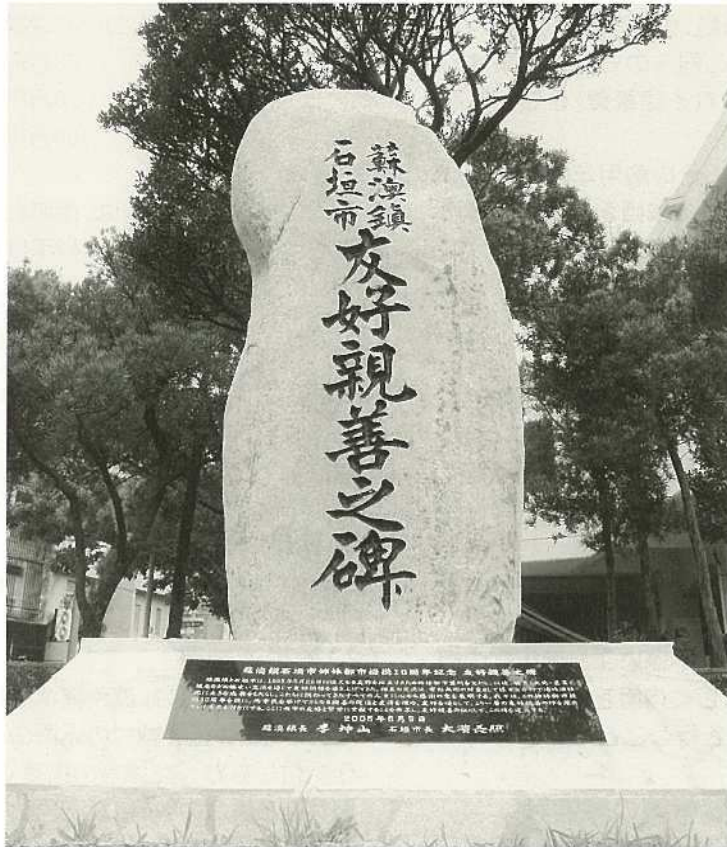
昨年6月に蘇澳鎮との姉妹都市提携10周年を記念して建立された「蘇澳鎮石垣市友好親善之碑」。

花蓮市にある花蓮空港を活用して、石垣市台湾間 にチャーター便を就航させようという積極性は、実 は台湾のほうから感じることができます。沖縄県も それに呼応し、C I Q(税関、出入国、検疫のことで、 人や貨物が海外に出る時や入る時に、必ず必要な手