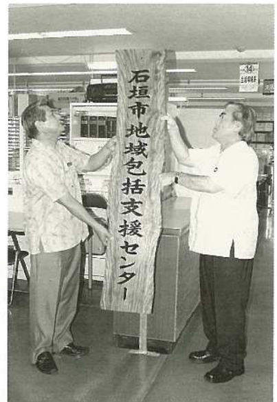
6月12日に石垣市地域包括支援センターの看板が、市役所内に設置されました。