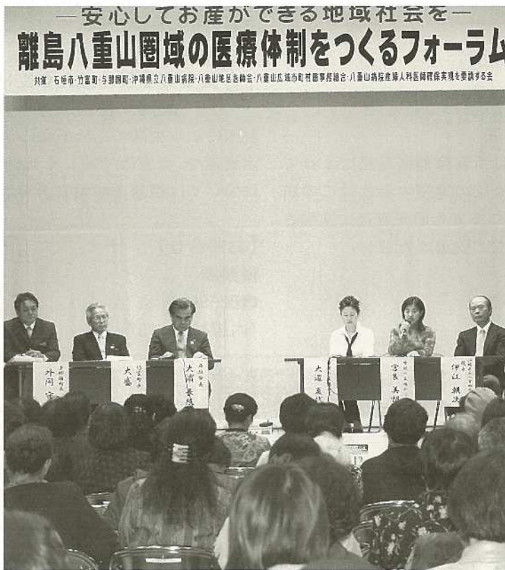
今年2月に離島医療を考えるフォーラムも開催された。全国的に地方の産婦人科などの医師不足が深刻な問題となっている。フォーラム後は、産婦人科・脳神経外科医師の確保を求める総決起集会も開催された。

医学部にも、卒業後に離島やへき地で勤務する義務を負うという「へき地医療枠」や「離島医療枠」などをつくる必要があると強く思います。 私も八重山病院長時代に医師確保に非常に苦労したわけですが、今日なお、基本的に何ら変わっていない点では、根本的な対応がそろそろ必要ではないでしょうか。