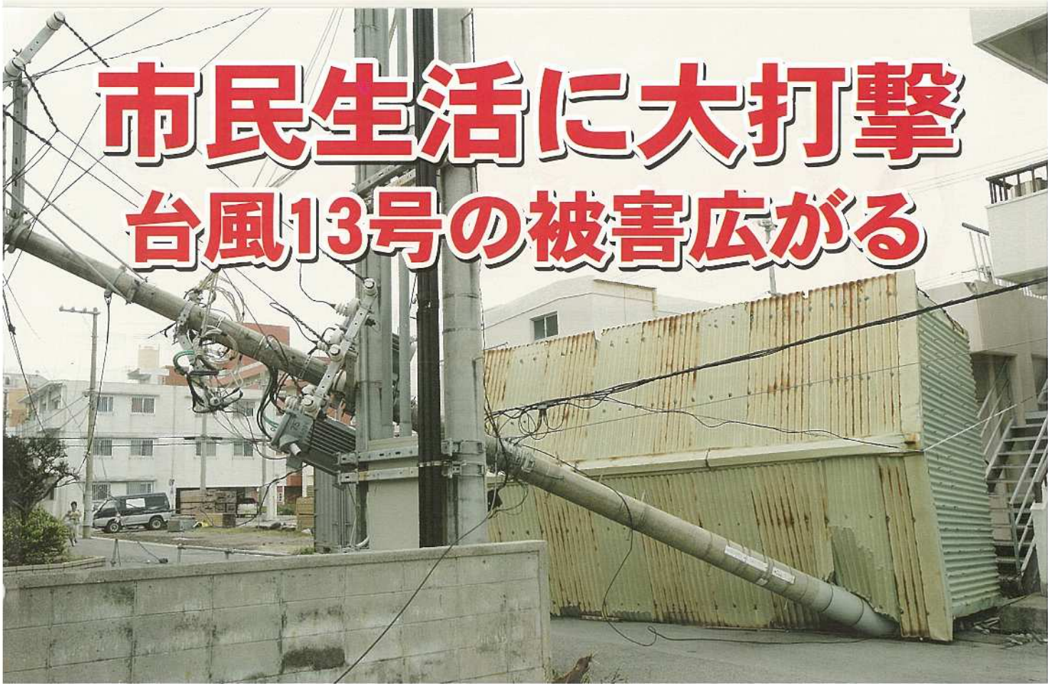
市内のいたるところで、家屋の倒壊などが見られた。