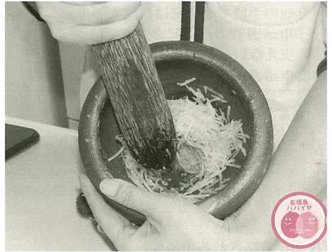
タイのパイヤサラダ、ソムナムの調理の様子

パイヤと同様に、中南米原産の野菜で地域により異なる食べ方をしている例として、トマトが挙げられます。トマトは、主にスペインとイタリアでは調理用、主にイギリスとアメリカ合衆国では生食用として発展しました。日本には明治時代初期に、アメリカ合衆国