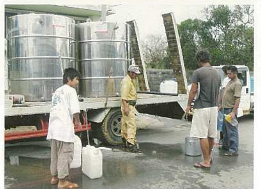
断水により給水車による給水活動も行われた。

やヤイトハタ養殖イケスなどの水産施設、漁船の水没など、広い範囲で被害を受けており、回復に大きな時間を要することが予測されます。