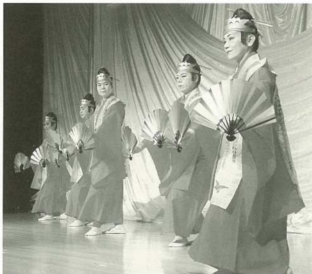
新年にかける思いを胸に初春の交歓会にはぎわった

さて、「年の初めに健康を祈る」、これが昔からの古い慣例でもあり、今尚、重視しなければならぬ