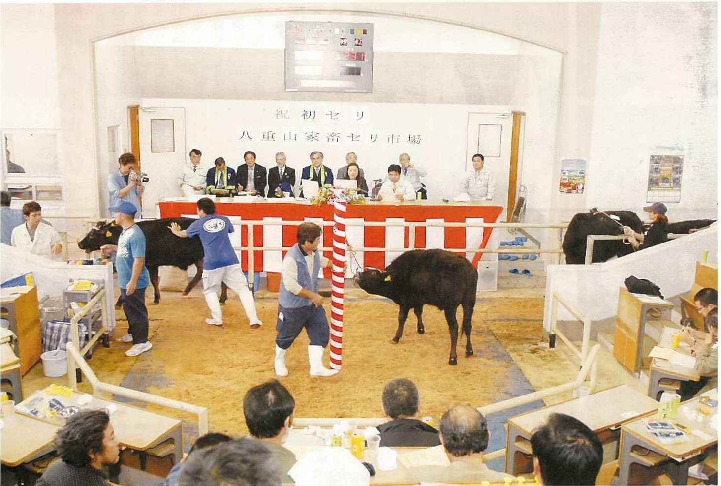
1月13日、初セリが八重山家畜市場で開催され、高値での取引が続きました。昨年好調であった取引は、八重山地域の第一次産業経済の牽引役として今年も順調な伸びが期待されています。