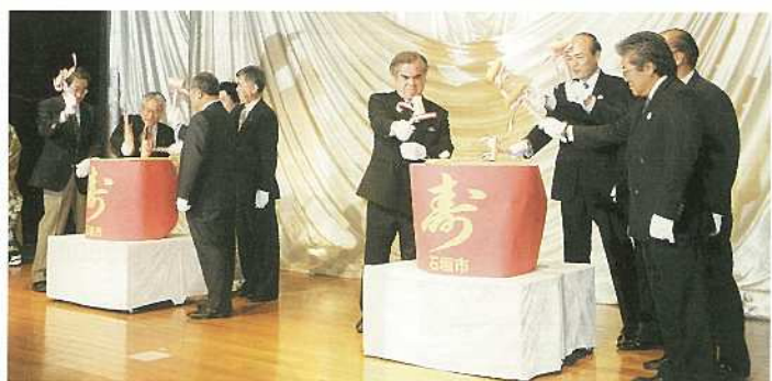
団体代表らによる鏡開き

いく。」と年頭のあいさつを述べ、決意を新たにしました。入嵩西整市議会議長のあいさつに続き、産業団体などの代表者らにより鏡開きが行われ、舞踊などが披露されるなど、会場は終始和やかな雰囲気で見守られ、年の初めを感じさせる、大きな期待に満ちた笑顔が多く見られました。