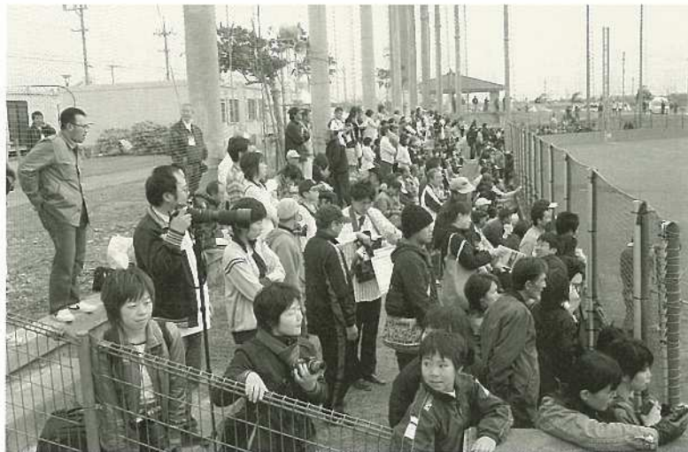
いしがきブルースタジアムをメイン会場にした千葉ロッテマリーンズの石垣島春季キャンプは大勢の市民の声援で賑わいました。

毎日のように報道されています。このことは石垣市の知名度がさらに全国的に認知されることになるし、ロッテファンならずともプロ野球ファンが注目する島になるかと思えます。そのことは、当然ながら観光客を呼び込むことにもなるし、経済的効果の側面からも大きなものがあると思えます。多くの少年野球の選手たちが連日押しかけていますし、プロ選手はイコール野球の頂点に立っている選