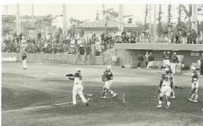
実践練習にスタンドの市民はクギづけ

石垣島キャンプは初日から練習会場周辺に大勢の市民が詰めかけ、二十五年ぶりとなるプロ野球のキャンプ実現にひととき大きな声援を選手へ送っていました。