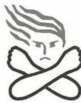
女性に対する暴力根絶のためのシンボルマーク

しました。生徒たちは橋本氏の話に耳を傾けDVのもたらす影響や防止方法について考え、生徒を題材とした寸劇には一喜一憂したりしながら真剣に見入っていました。