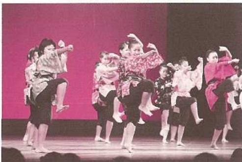
ウイングキッズリーダーズの勇ましい演舞。