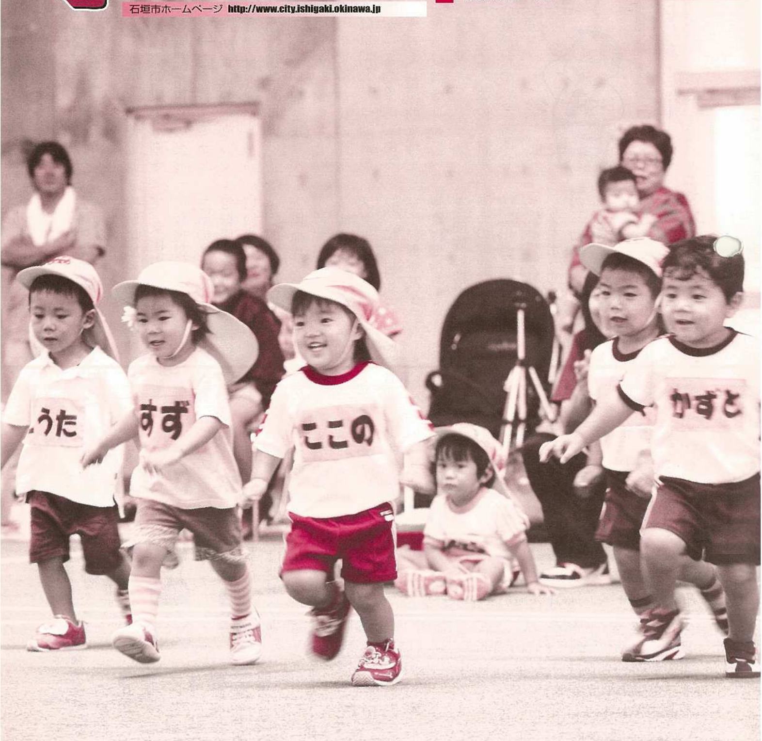
10月10日、市立石垣保育所の運動会が屋内練習場で開催され、「スポーツの秋」を満喫しました。子ども達が、一生懸命に走ったり、演技する姿に、応援にかけつけた家族からは大きな声援があくられていました。