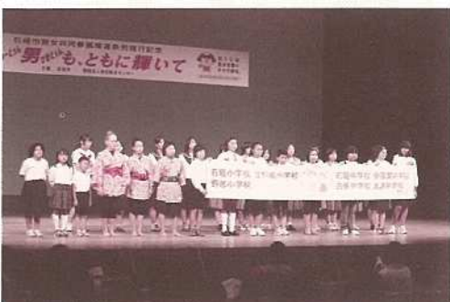
DVD制作に協力した小中学生を紹介。