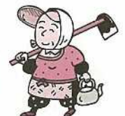
年金資産の運用実績