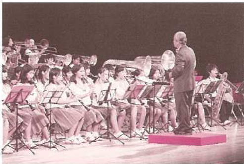
石垣第二中吹奏楽部による演奏。

また、石垣第二中吹奏楽部の演奏、ウイングキッズリーダーズの演奏も披露されたほか、市の男女共同参画啓発用DVD制作に協力した小中学生が紹介されました。