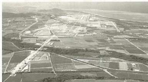
着々と進む新空港建設。