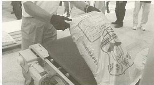
石垣市たい肥センターが本格稼働。