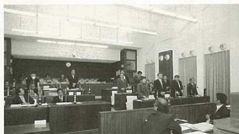
石垣市自治基本条例が市議会で可決。