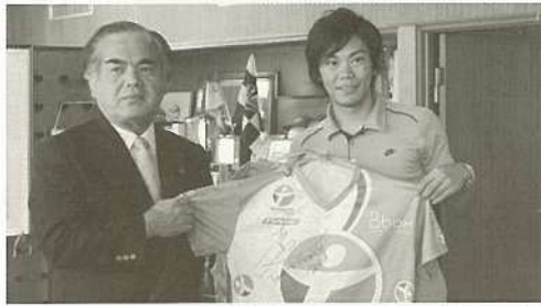
市出身の新城幸也選手がツール・ド・フランスに初参戦。