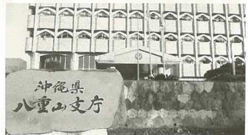
県の行政改革に不安の声。