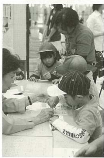
手話も体験。むずかしいなあ。