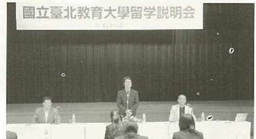
台北教育大学への留学がスタート。