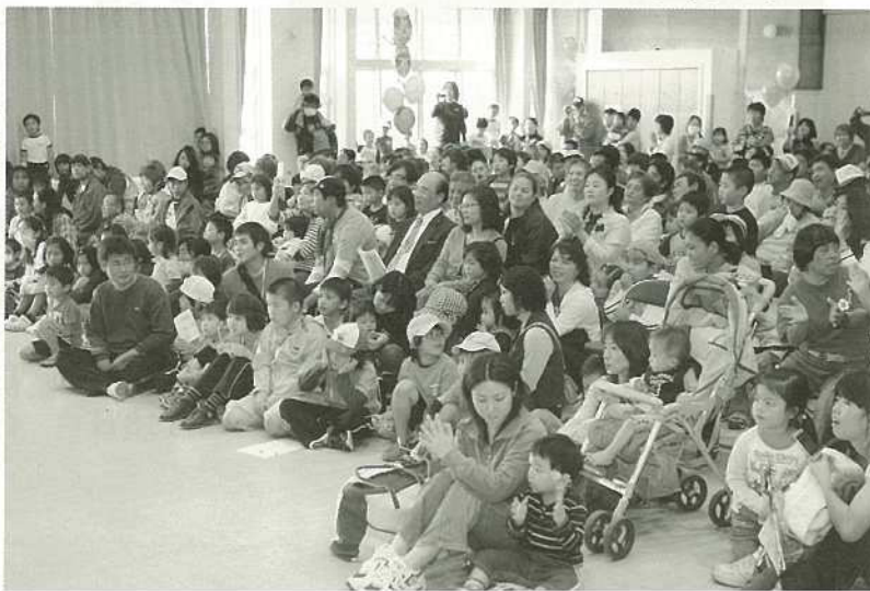
舞台上で繰り広げられるパフォーマンスを楽しむ。

多彩な催しに大勢の市民 12月6日、健康福祉センターで第20回健康福祉まつり、第29回障がい者週間・市民のつどいが同時開催され、大勢の市民でにぎわいました。 健康づくりウォーキングなどの運動体験、骨密度測定などの健康チエック、講演会、ハンディキャップ体験などが行われたほか、施設内ホールの舞台「ふれ愛ステージ」では、三線や車いすダンス、空手演舞などが繰り広げられ、訪れた市民も各催しに参加しながら楽しみました。