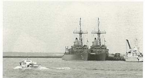
米海軍掃海艇が石垣港へ入港。