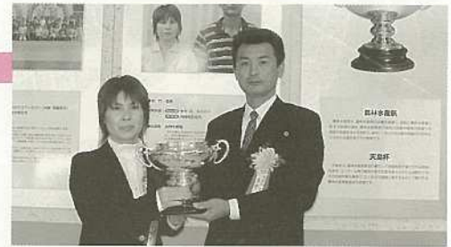
多宇夫妻、受賞次々。全国に認められる農業経営。