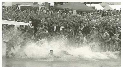
増えるトライアスロン大会参加者。