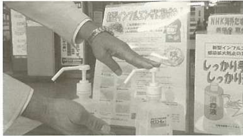
各方面に影響を及ぼした新型インフルエンザ。