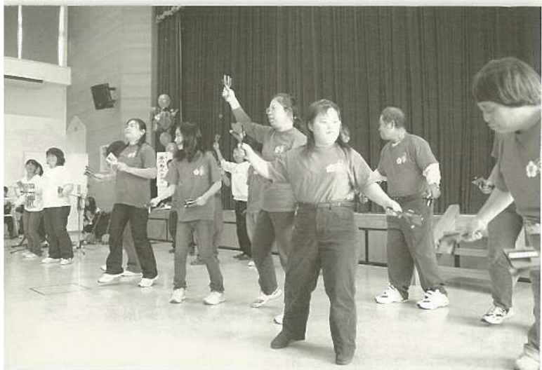
リズムにあわせてノリノリでダンス。

(上段)ハンディキャップ体験で四苦八苦。(下右)点字に挑戦。(下左)親子で工作。