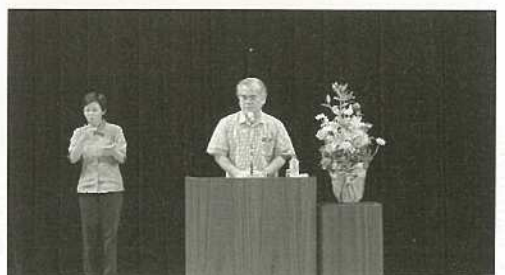
石垣市男女共同参画推進条例がスタート。