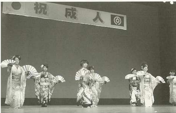
鶯の鳥節を舞う実行委員の皆さん。

593名が石垣市成人式に参加し、新たな門出を祝いました。アトラクションでは、新成人の皆さんが手づくりで、舞台演出をかざりました。