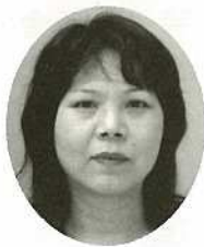
恩河 静江 ① 新川・新栄町・浜崎町 ② 9・10・12 区