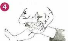
冷水または氷のうで刺傷部を冷やす。 つめた過ぎる時はガーゼの上から冷やす