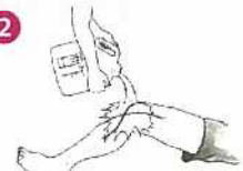
食酢をたっぷりかける