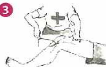
指先で触手を優しく剥ぎ取る。 指先や掌は刺糸が刺され難い