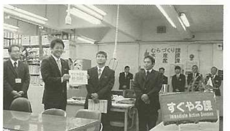
様々な相談が寄せられる すぐやる課