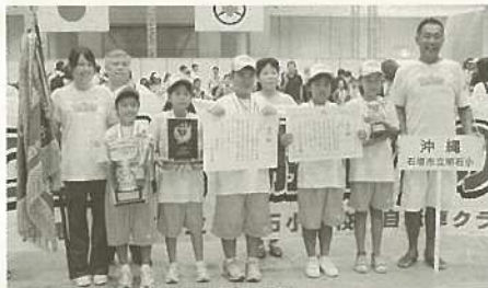
お見事！明石小 全国制覇