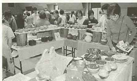
市民や焼物ファンで賑わったやきもの祭り