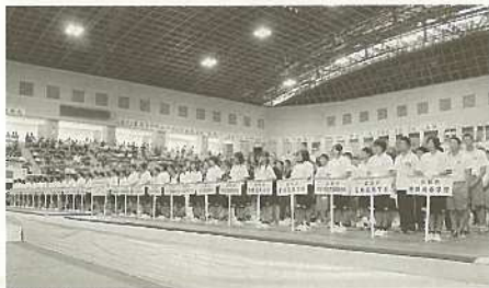
美ら島沖縄総体2010レスリング競技