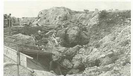
白保竿根田原洞穴周辺遺物散布地