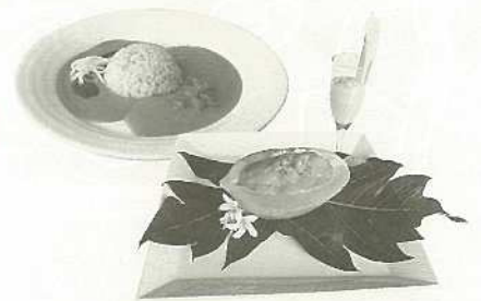
石垣島パイヤカレー