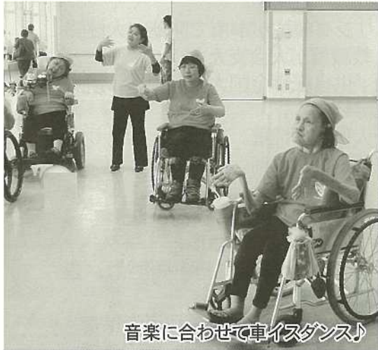
音楽に合わせて車イスダンス♪