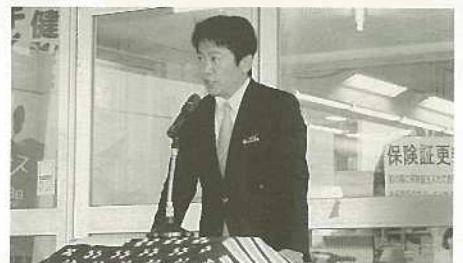
第18代石垣市長 中山義隆氏