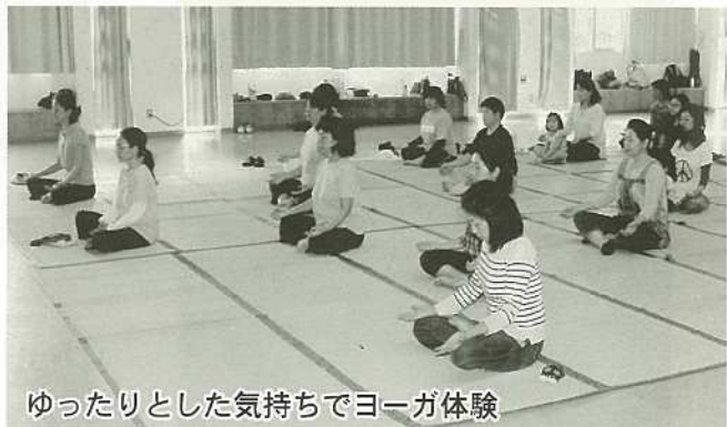
ゆったりとした気持ちでヨーガ体験