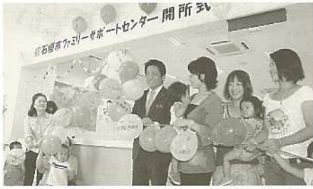
市ファミリーサポートセンターがオープン