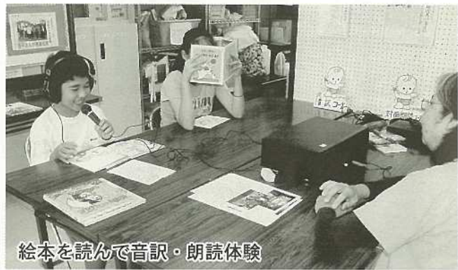
絵本を読んで音読・朗読体験