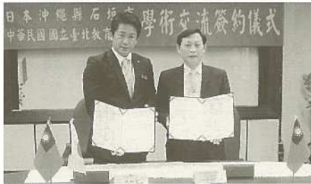
国立台北教育大学と調印