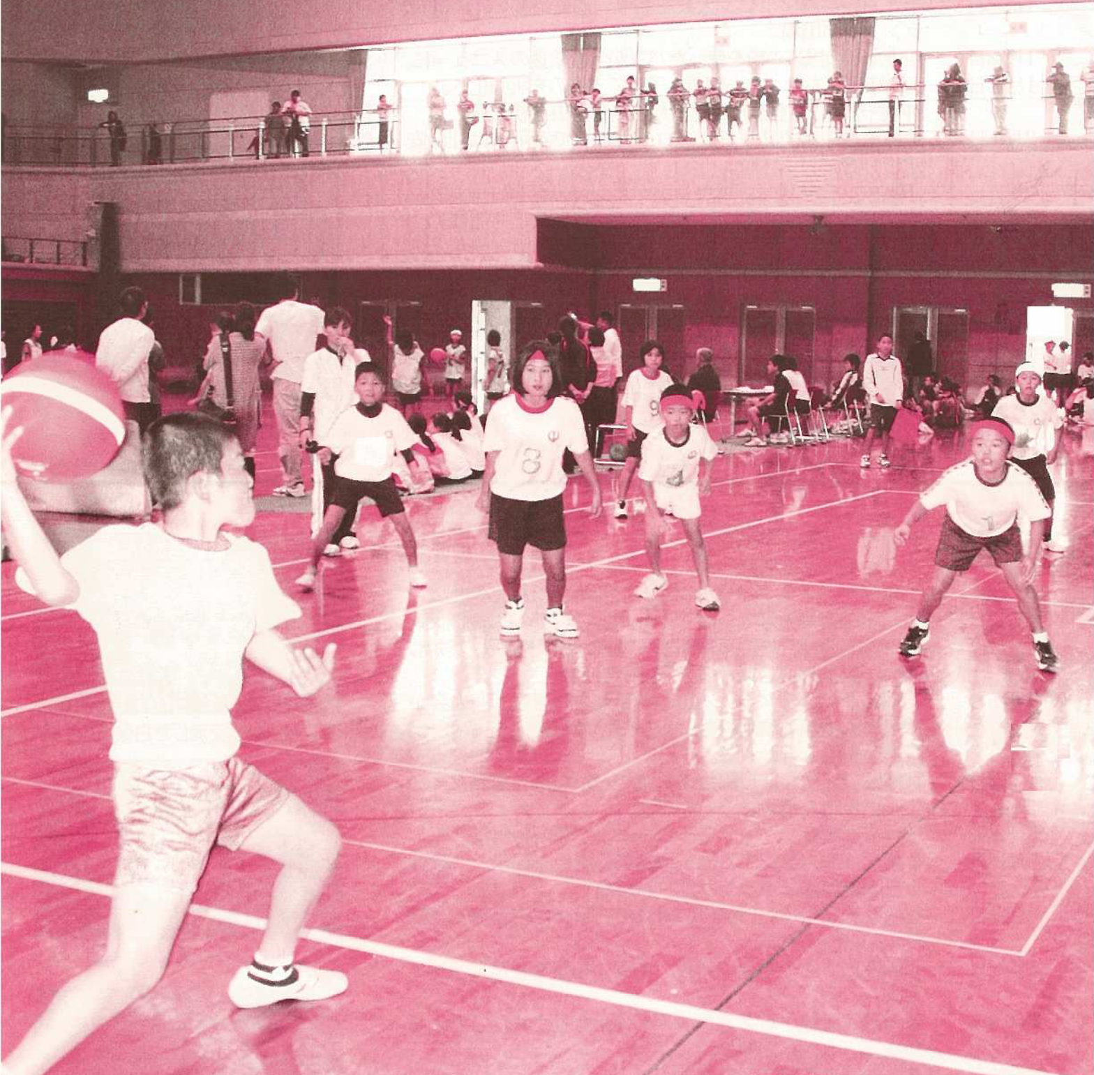
12月12日、総合体育館で行われた第18回闘球児スーパードッジ選手権大会。相手の動きを見て、内野と外野で連携攻撃。相手にヒットすると大きな歓声が上がりました。