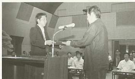
新たに22人の議員が誕生