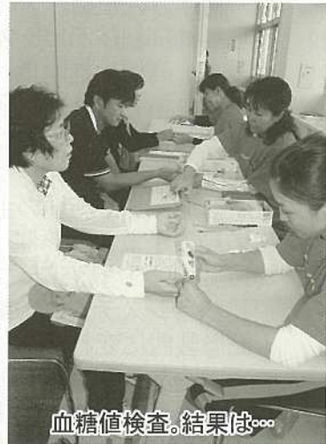
血糖値検査。結果は○○○