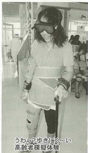
うわっ？歩きにく〜い 高齢者模擬体験