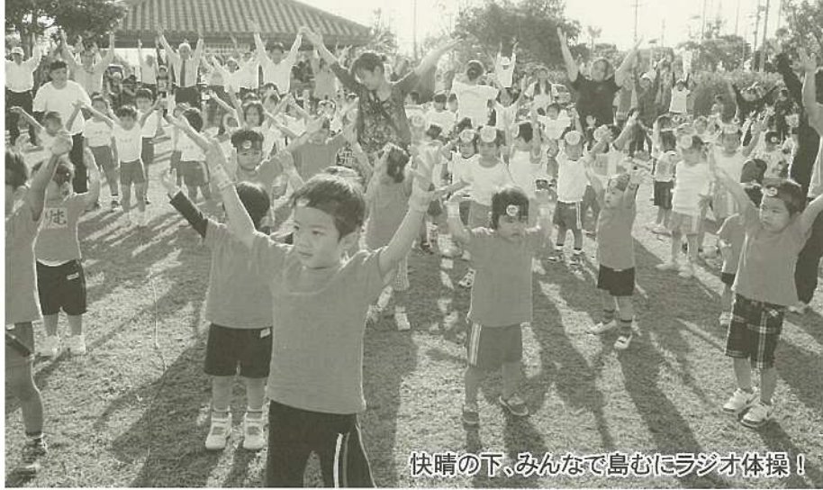
快晴の下、みんなで島むにラジオ体操！

12月5日、第21回健康福祉まつり、第30回障がい者週間・市民のつどいが同時開催され、好天の中、大勢の市民が参加しました。 新川字会島むにラジオ体操で身体をほくして開会。健康づくりウォーキングなどの運動体験、血糖値検査などの健康チェック、健康相談、講演会、ハンデキャップ体験、バザーなどが行われました。ホール「ふれ愛ステージ」では三線演奏や車イスダンス、健康体操などが催され、また、健康食料理も展示されました。訪れた市民は各コーナーの催しを楽しみました。