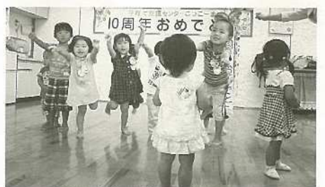
交流の場、いこいの場「こっこーま」