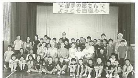
アスリートと交流した白保小の児童