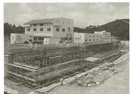
水処理施設増設工事状況(新川・白若原)