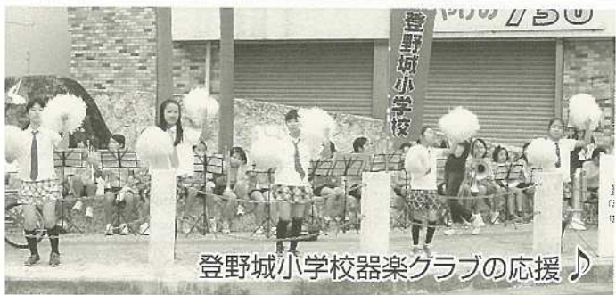
登野城小学校器楽クラブの応援♪