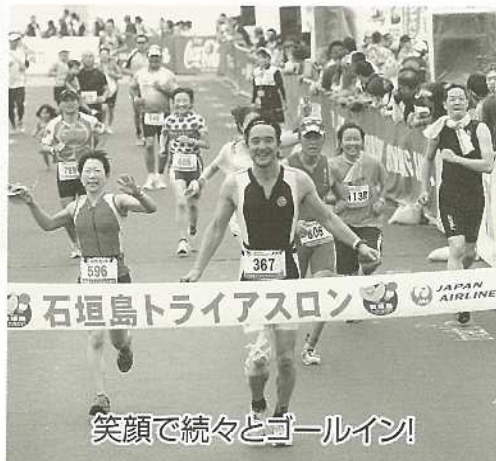
笑顔で続々とゴールイン!