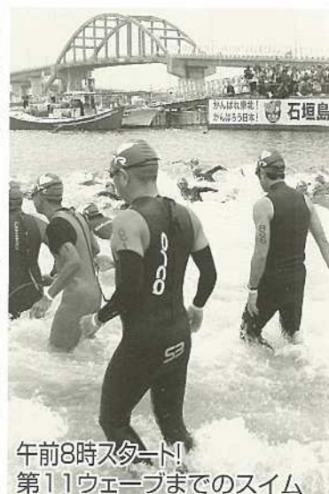
午前8時スタート! 第11ウェーブまでのスイム