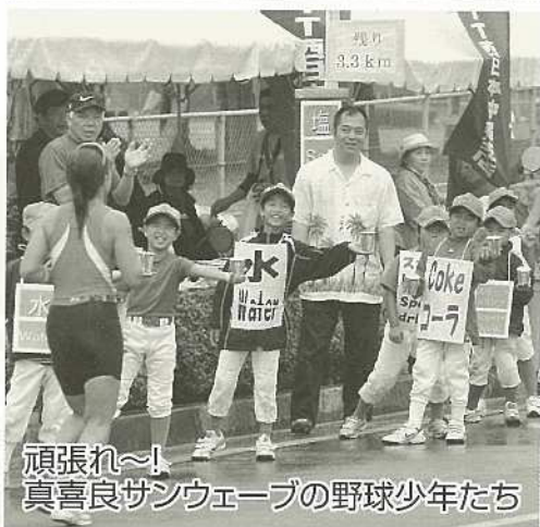
頑張れ~! 真喜良サンウェーブの野球少年たち