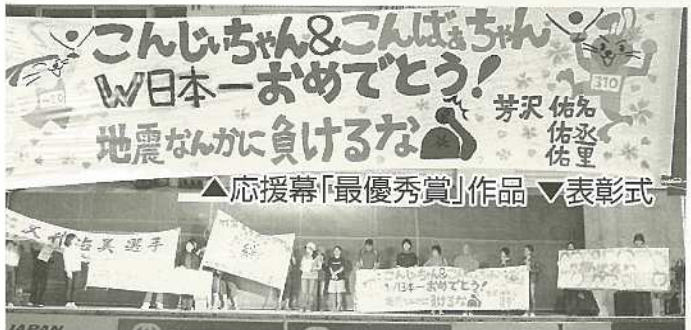
▲応援幕「最優秀賞」作品 ▼表彰式