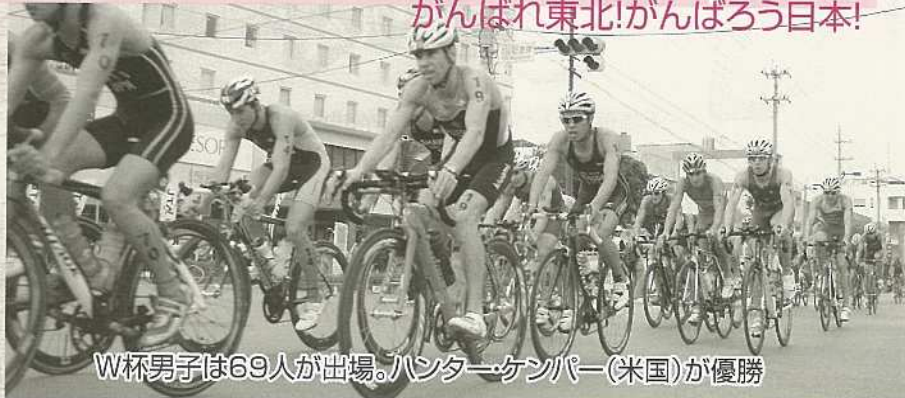
W杯男子は69人が出場。ハンター・ケンパー(米国)が優勝