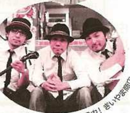
全国ライブで人気上昇中! さいやま商店