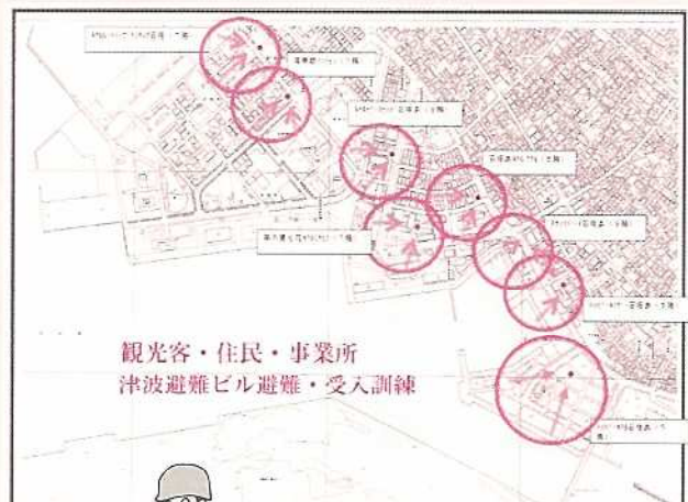
観光客・住民・事業所 津波避難ビル避難・受入訓練