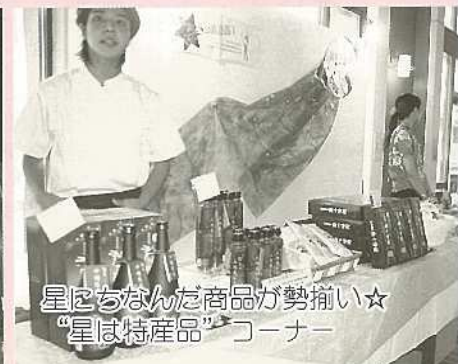
星にちなんだ商品が勢揃い☆ “星は特産品”コーナー