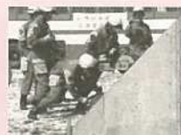
平成16年度総合防災訓練写真より