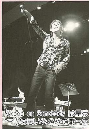
Scoop on Somebody は星まつりの思いをこめて歌った