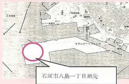
石垣市八島一丁目地先