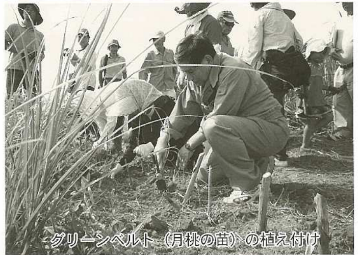
グリーンベルト(月桃の苗)の植え付け