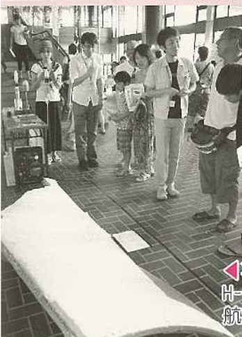
石垣島の海岸で回収されたH-11Bロケットの破片を宇宙航空研究開発機構から紹介