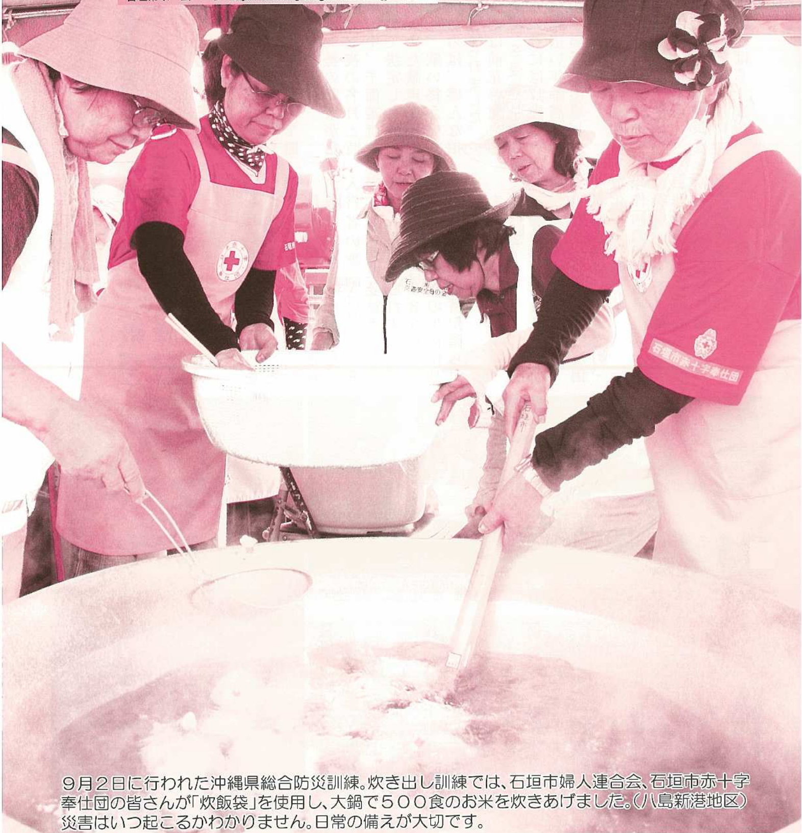
9月2日に行われた沖縄県総合防災訓練。炊き出し訓練では、石垣市婦人連合会、石垣市赤十字奉仕団の皆さんが「炊飯袋」を使用し、大鍋で500食のお米を炊きあげました。(八島新港地区) 災害はいつ起こるかわかりません。日常の備えが大切です。

石垣市ホームページ http://www.city.ishigaki.okinawa.jp