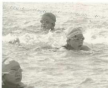
スイムはビート板を使って!