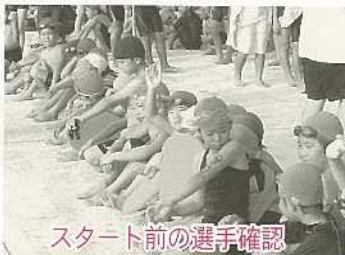
スタート前の選手確認