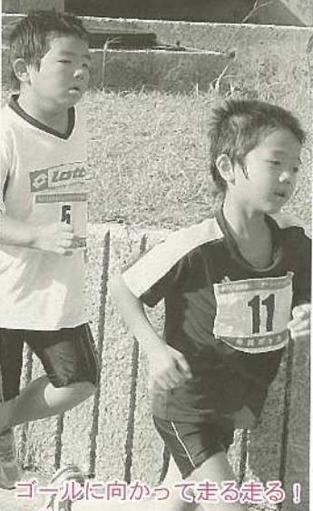
ゴールに向かって走る走る!