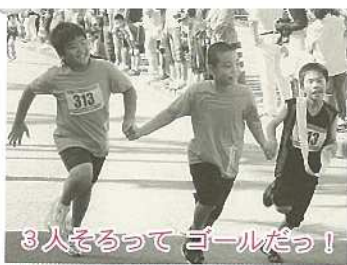
3人そろってゴールだっ!