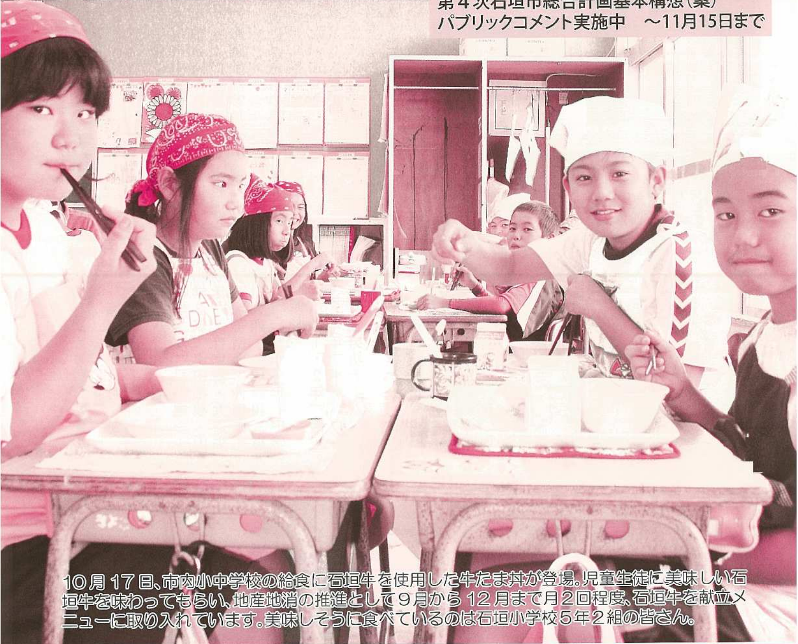
10月17日、市内小中学校の給食に石垣牛を使用した牛たま丼が登場。児童生徒に美味しい石垣牛を味わってもらい、地産地消の推進として9月から12月まで月2回程度、石垣牛を献立メニューに取り入れています。美味しそうに食べているのは石垣小学校5年2組の皆さん。

第4次石垣市総合計画基本構想(案) パブリックコメント実施中 ～11月15日まで