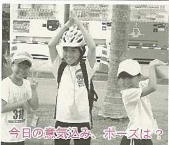
今日の意気込み、ポーズは?