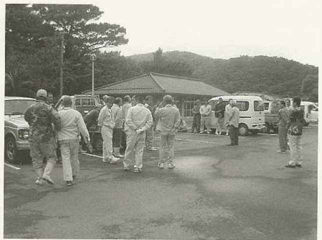
午前6時45分、開会式に集まる猟友会の皆さん。この後、3カ所で駆除が開始された。

駆除には猟友会員41人が参加。午前7時から午後5時までかけてキジ47羽、クジャク17羽、合計64羽を駆除しました。