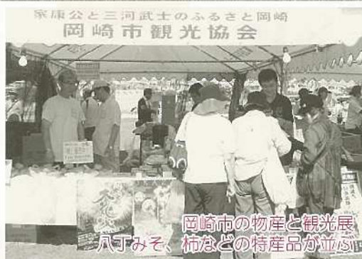
岡崎市の物産と観光展 八丁みそ、柿などの特産品が並ぶ