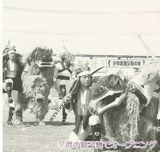
平得の獅子舞でオープニング