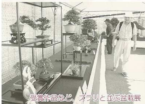
受賞作品など、スラリと並ぶ盆栽展