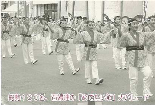
総勢120名、石垣連の「めでたい節」大パレード