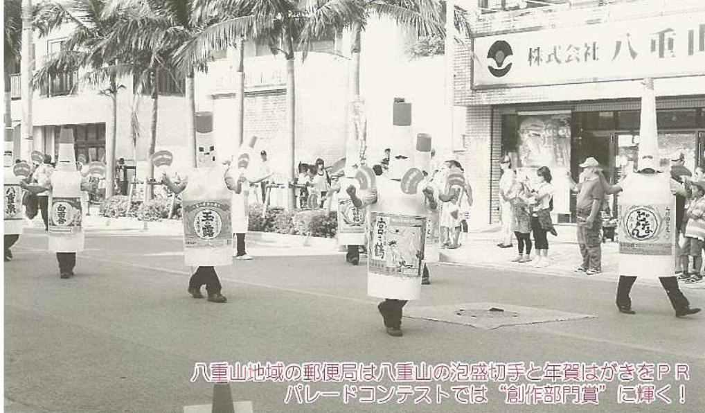
八重山地域の郵便局は八重山の泡盛初手と年賀はがきをPRパレードコンテストでは「創作部門賞」に輝く！

石垣島最大のイベント「第47回2011石垣島まつり」は晴天のもと、二日間にわたり開催されました。 初日は、平得の獅子舞で幕開け。各団体によるステージパフォーマンス、サタデーナイトミュージックでは、地元出身のミュージシャンの歌を満喫、友好都市物産展や展示即売会に大勢の市民で賑わいました。 翌日の市民大パレードは初めてコンテストを実施。趣向を懲らしたパレードに多くの見物客が集まりました。パレードコンテスト入賞団体は次のとおり。【最優秀賞】盛岡さんさ踊り・さんさ好み【演技力部門賞】琉球國祭り太鼓【創作部門賞】八重山地域の郵便局