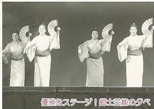
優雅なステージ！郷土芸能の夕べ