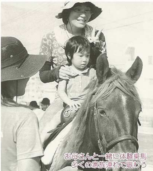
お母さんと一緒に体験乗馬 多くの家族連れで賑わう