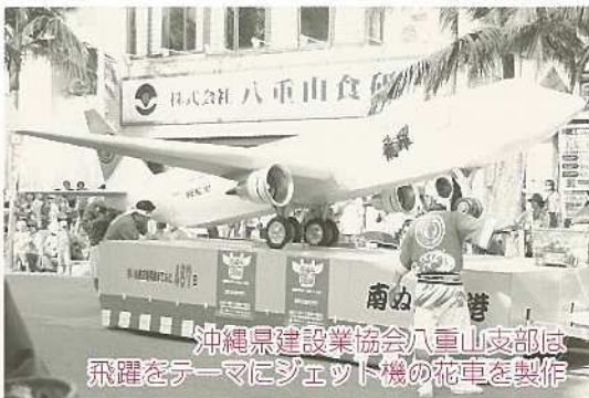
沖縄県建設業協会八重山支部は 飛躍をテーマにジェット機の花車を製作