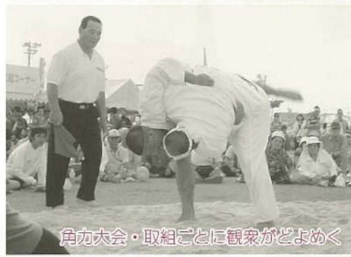
角力大会・取組ごとに観客がどよめく