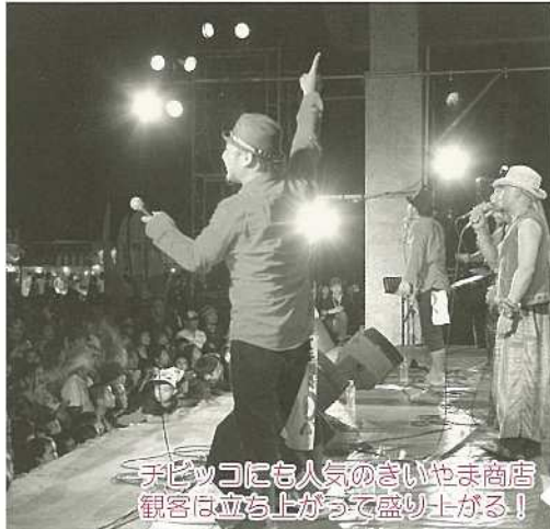
手ピッコにも人気のきいやま商店 観客は立ち上がって盛り上がる！