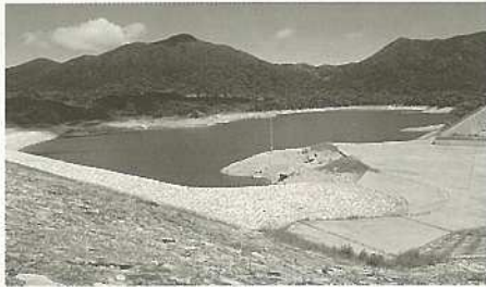
貯水率が低下した真栄里ダム