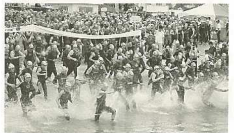
石垣島トライアスロン2011