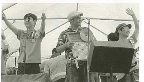
石垣島うたの日ライブ