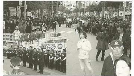
千葉ロッテ日本一記念パレード