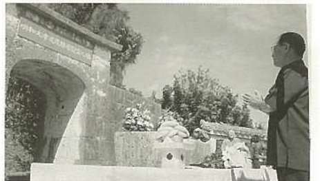
明和大津波遭難者慰霊祭