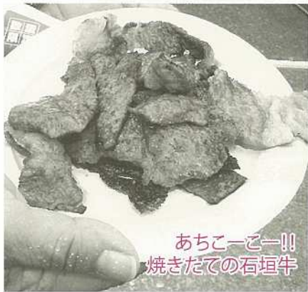
あちこち!! 焼きだての石垣牛