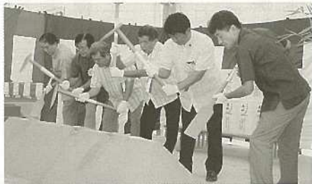
石垣空港ターミナルビル(仮称)・起工式