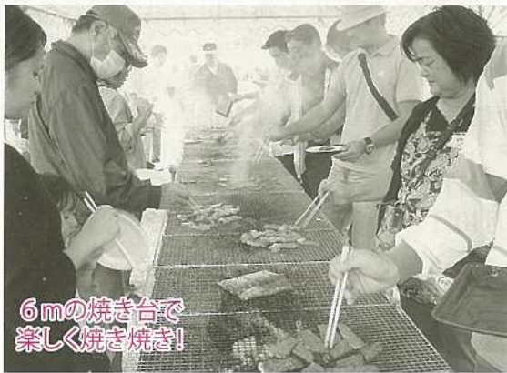
6mの焼き台で 楽しく焼き焼き!!