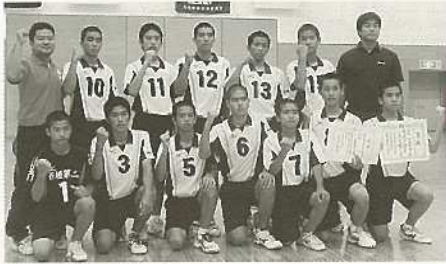
全国大会に初出場・石二中男子バレー部