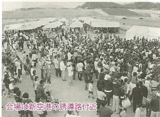
会場は新空港の誘導路付近