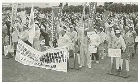
TPP交渉参加阻止郡民総決起大会