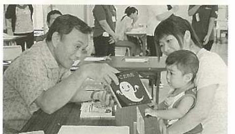
図書館のこっからブックスタート事業