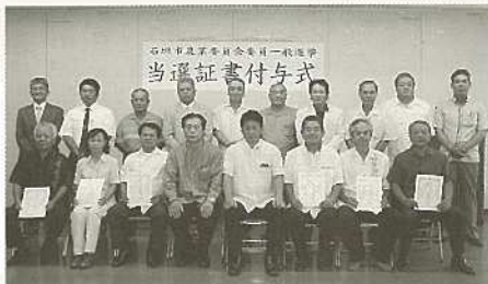
農業委員選挙・当選証書付与式