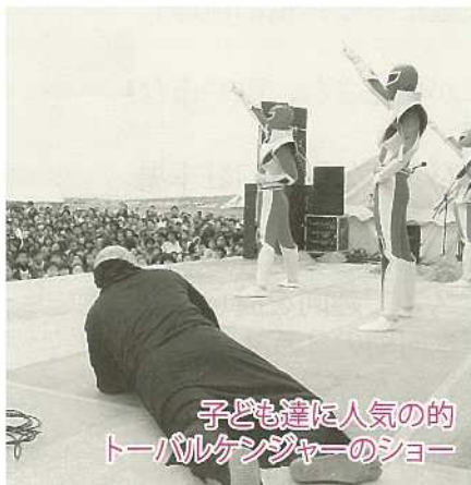
子ども達に人気の的トールケンジャーのショー

ステージでは子ども向けのイベントやミュージシャンのライブ。ラジコン飛行デモなど多彩なアトラクションが盛りだくさん。石垣牛のバーベキューを楽しみ、アトラクションに人々がにぎわう光景が見られました。