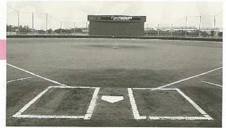
中央運動公園野球場