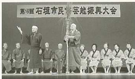
地域の貴重な民俗芸能を披露