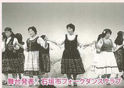
舞台発表：石垣市フォークダンスクラブ