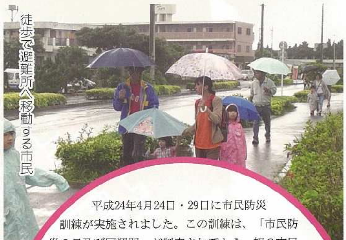
徒歩で避難所へ移動する市民

平成24年4月24日・29日に市民防災訓練が実施されました。この訓練は、「市民防災の日及び同週間」が制定されてから、初の市民一体となった実働訓練であり、また、津波災害対策において最重要となる「自助」「共助」の推進への第一歩と位置付け、訓練実施を通して、個人、地域組織(字会、自治公民館、社会福祉施設等)での課題を把握することが目的でありました。24日の訓練時には、各津波避難ビルへ288名の地域住民、事業所、社会福祉施設等の訓練参加がありました。29日の訓練開始時は、大雨にもみまわれましたが、各津波一時避難場所へは、1,400名を超える地域住民の参加がありました。今後とも、防災訓練や啓発事業等を通して、市民、行政が一体となり、一人でも多くの生命・財産の安全確保が図れるよう減災への取り組みを進めて行きましょう。