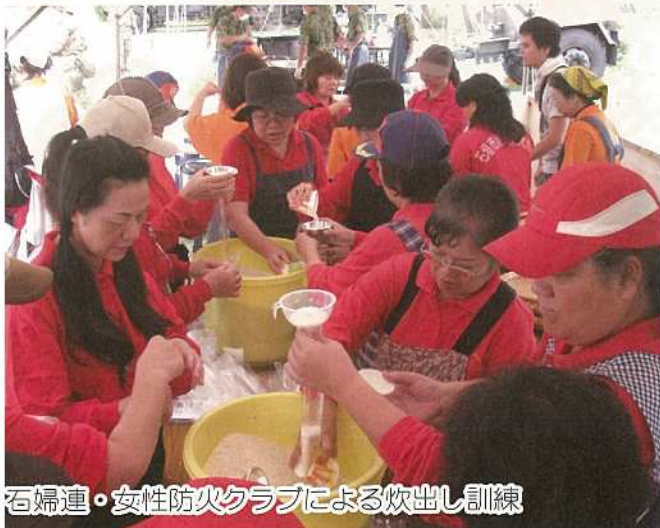
石婦連・女性防火クラブによる炊出し訓練