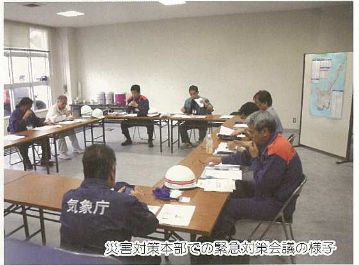
災害対策本部での緊急対策会議の様子