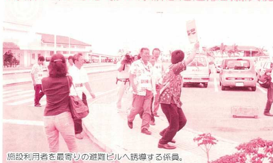
施設利用者を最寄りの避難ビルへ誘導する係員。

市民防災の日となる4月24日、市内各地の公的機関や学校等で津波を想定した避難訓練が初めて実施されました。訓練内容は石垣島南方を震源とする震度6弱の地震が発生し5メートルの津波が襲来すると想定し、各避難ビルへ避難するというもの。市街地で最も人があつまる離島ターミナルではテナントの従業員や各団体の職員300名あまりが参加し、あらかじめ用意されたマニュアルに沿って防災無線放送が鳴り響くとともに避難行動を開始し、近隣高層ホテルへの利用客の誘導、傷病者の搬送等の訓練が行われました。