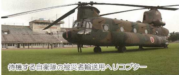
待機する自衛隊の被災者輸送用ヘリコプター