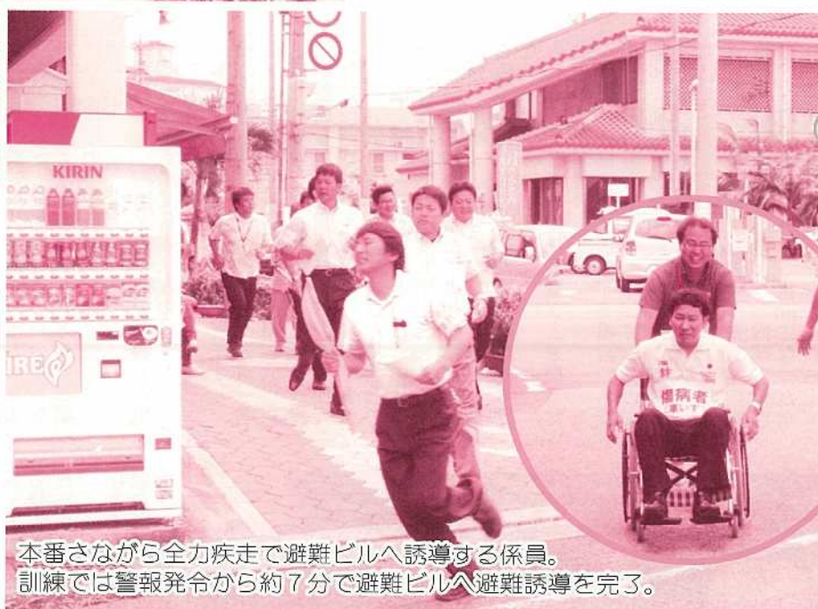
本番さながら全力疾走で避難ビルへ誘導する係員。訓練では警報発令から約7分で避難ビルへ避難誘導を完了。