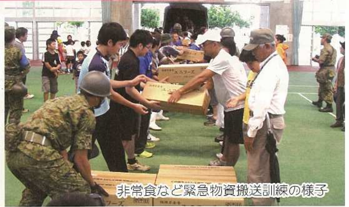
非常食など緊急物資搬送訓練の様子