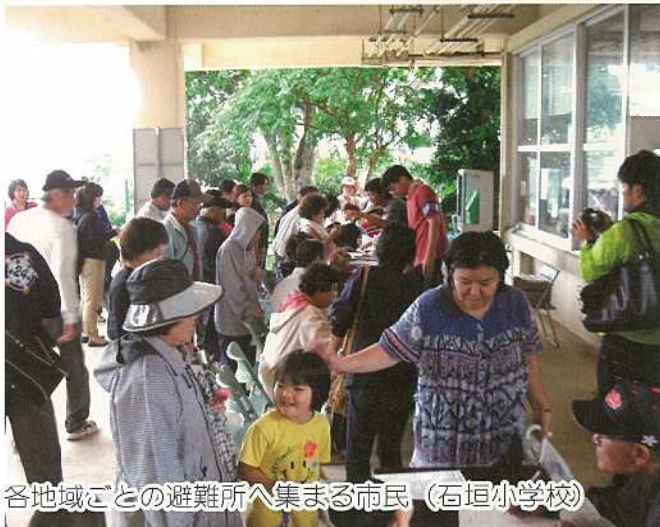
各地域ごとの避難所へ集まる市民(石垣小学校)