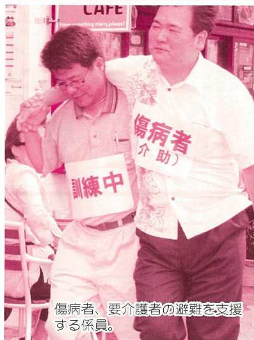
傷病者、要介護者の避難を支援する係員。

市民防災の日となる4月24日、市内各地の公的機関や学校等で津波を想定した避難訓練が初めて実施されました。訓練内容は石垣島南方を震源とする震度6弱の地震が発生し5メートルの津波が襲来すると想定し、各避難ビルへ避難するというもの。市街地で最も人があつまる離島ターミナルではテナントの従業員や各団体の職員300名あまりが参加し、あらかじめ用意されたマニュアルに沿って防災無線放送が鳴り響くとともに避難行動を開始し、近隣高層ホテルへの利用客の誘導、傷病者の搬送等の訓練が行われました。