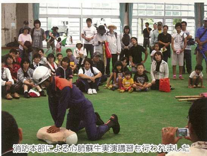
消防本部による心肺蘇生実演講習も行われました

平成24年4月24日・29日に市民防災訓練が実施されました。この訓練は、「市民防災の日及び同週間」が制定されてから、初の市民一体となった実働訓練であり、また、津波災害対策において最重要となる「自助」「共助」の推進への第一歩と位置付け、訓練実施を通して、個人、地域組織(字会、自治公民館、社会福祉施設等)での課題を把握することが目的でありました。24日の訓練時には、各津波避難ビルへ288名の地域住民、事業所、社会福祉施設等の訓練参加がありました。29日の訓練開始時は、大雨にもみまわれましたが、各津波一時避難場所へは、1,400名を超える地域住民の参加がありました。今後とも、防災訓練や啓発事業等を通して、市民、行政が一体となり、一人でも多くの生命・財産の安全確保が図れるよう減災への取り組みを進めて行きましょう。