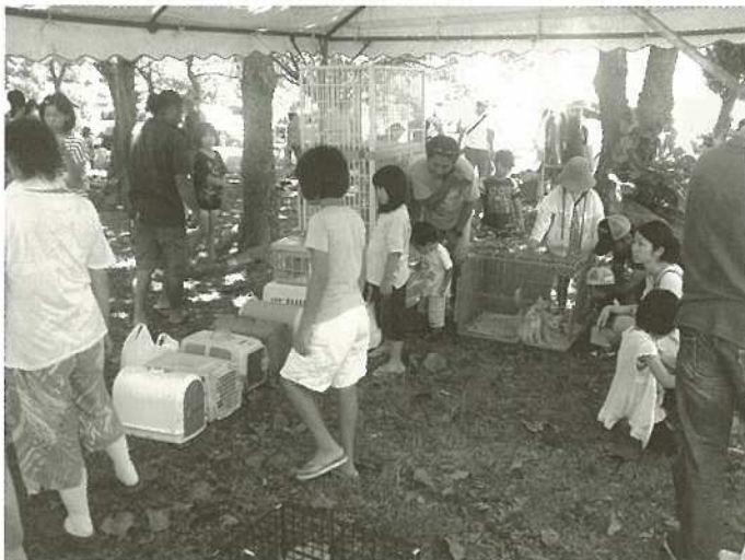
6月24日に行われた譲渡会の様子(浜崎公園)

いと思っています。最後に防災計画の中で震災時に犬や猫、その他ペット、家畜を含めて取り残されて大変なことになっているという状況なので、もちろん避難所での問題もありますが、まずは連れて逃げないことには野生化してしまつて手が付けられなくなるので、震災等の場合には飼い主が責任をもって同行避難できないかを考えて欲しいです。今回東北の震災の時にペットの同行での避難所への出入りが認められずに避難が遅れたり、ペットと車の中で過ごしてエコノミー症候群になったりした例があるので検討して頂きたいです。