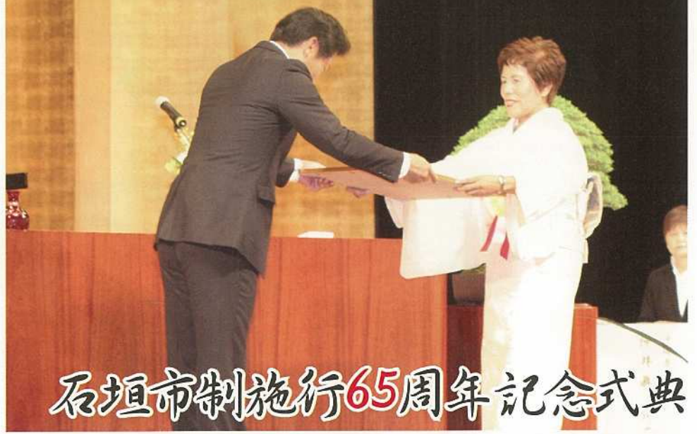
石垣市制施行65周年記念式典

本市は7月10日、石垣市民会館大ホールで石垣市制65周年記念式典を開催し、先人の偉業を偲び、将来の発展を誓いました。式典では、中山義隆市長が「石垣市の歴史は戦後復興の歩みそのものであり、歴代市長、議員や市民といった先代達の苦労と英知が市政発展の礎となっています。来年には新石垣空港が開港し国際線を兼ね備えた東アジアの玄関口としてアジアゲートウェイ構想を推進する」と