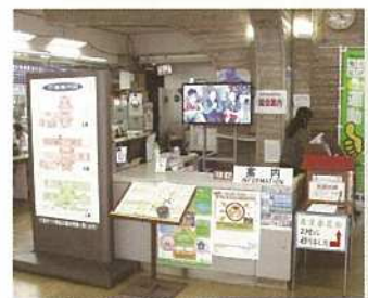
玄関ロビー正面に移動した案内窓口

ATM設置にともない、これまで玄関入り口右側に設置されていた総合案内窓口が玄関正面に移ったことにより利用者に分かり易い場所となりました。