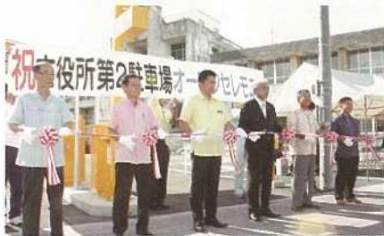
オープニングセレモニーの様子(7月27日)

石垣市役所西側の消防庁舎跡に石垣市役所第2駐車場が有料駐車場としてオープンしました。