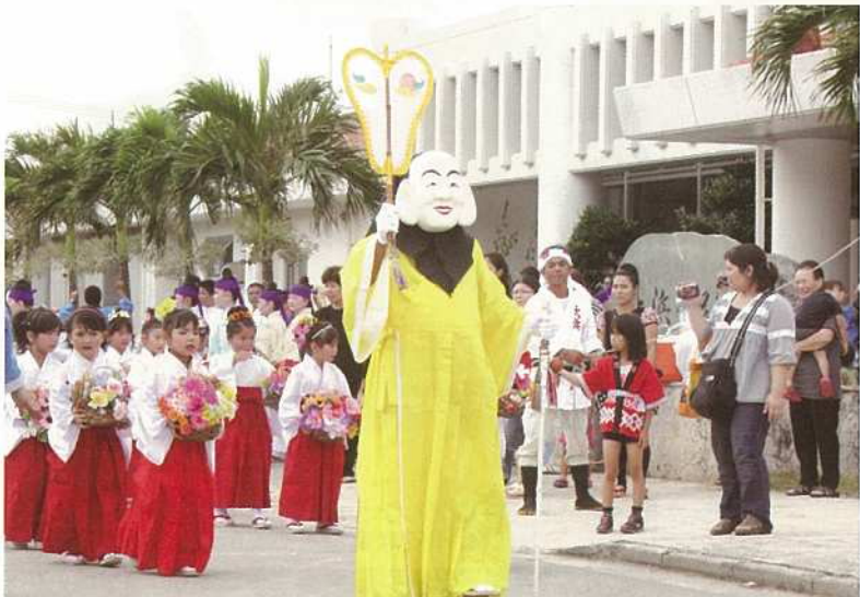
女兒21人を従えたミルク行列(大浜)