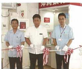
ATM利用開始テープカットの様子

7月23日、石垣市役所玄関ロビーに新しく沖縄銀行ATMが設置されました。これまで、沖縄銀行のATM設置を要望する声を受け設置が実現しました。市役所利用者の利便性の向上につながるものと思います。