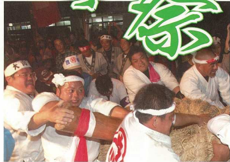
最後は会場にいる参加者が東西に別れての大綱引き！(四カ字)