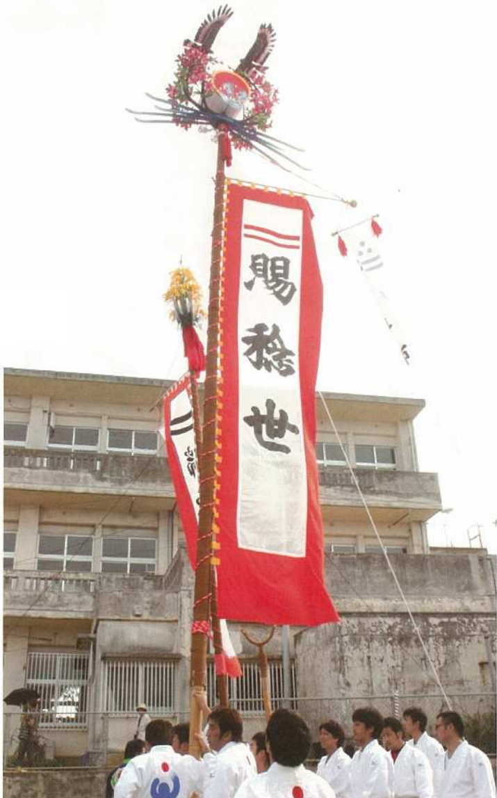
市役所旗頭も大浜豊年祭にて4年ぶりに奉納。(大浜)