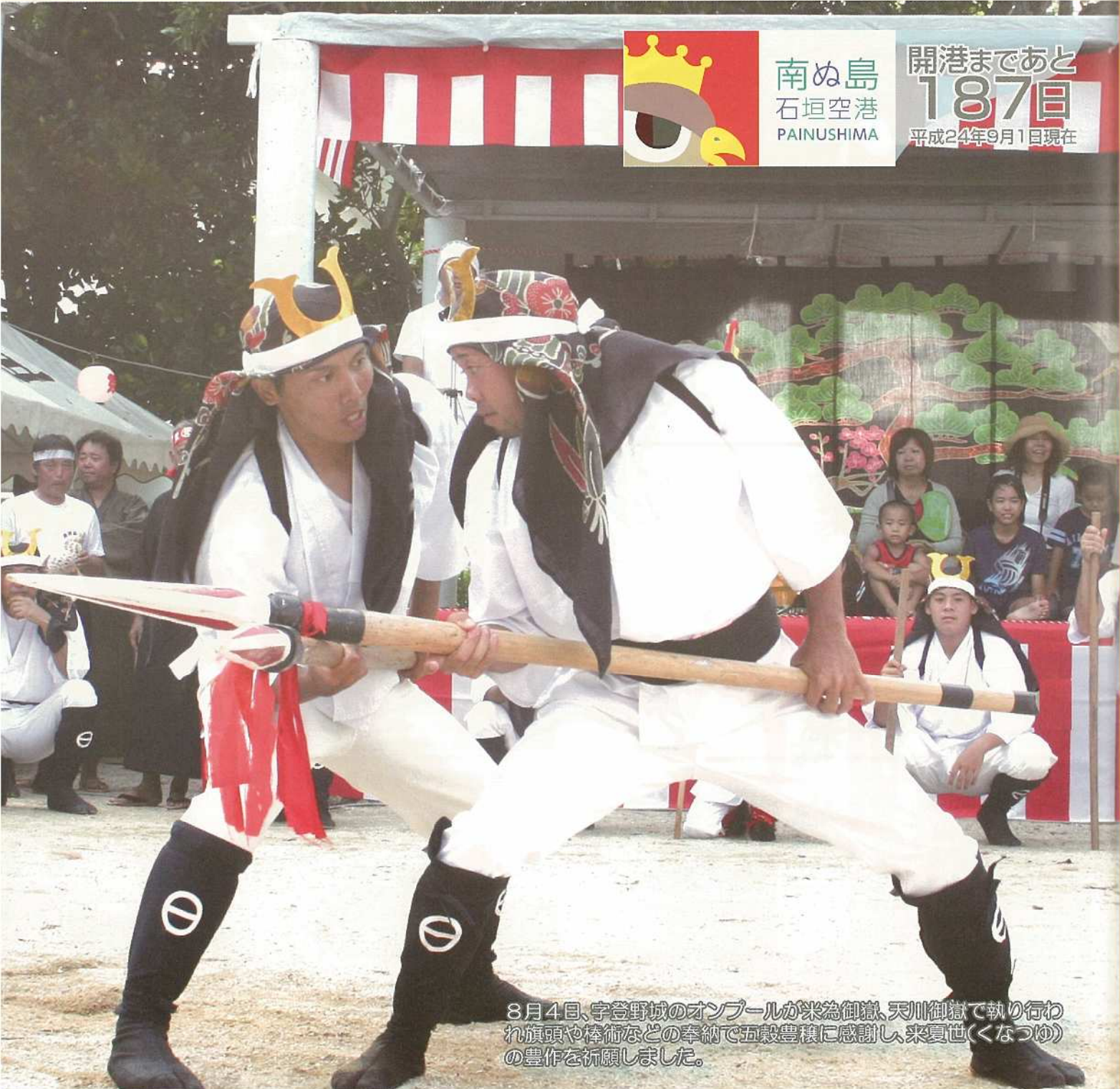
8月4日、宇登野城のオンブールが米為御嶽、天川御嶽で執り行われ旗頭や棒術などの奉納で五穀豊穣に感謝し、来夏世(くまつゆ)の豊作を祈願しました。