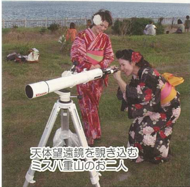
天体望遠鏡を覗き込む ミス八重山のお二人