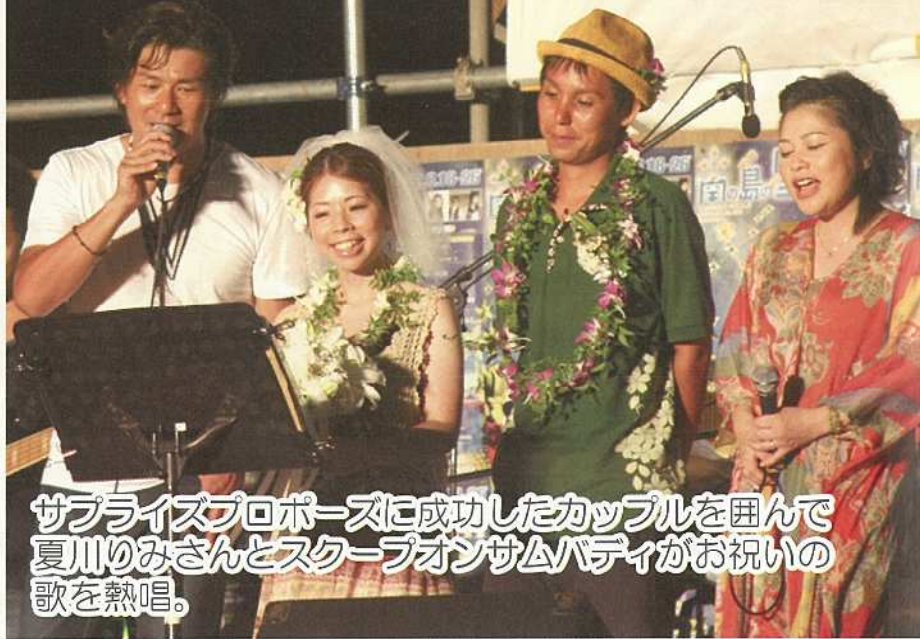
サプライズプロポーズに成功したカップルを囲んで 夏川りみさんとスクープオンサムバディがお祝いの 歌を熱唱。

南の島の星まつり2012夕涼みライブ&ライトダウン星空観望会が8月18日、石垣新港地区サザンゲート広場で開催されました。会場には約8000名の観光客や市民が訪れました。夕涼みライブを前に、今回の南の島の星まつりの目玉である「星空コン」をPRするコーナーでは会場でサプライズプロポーズが行われるなど例年になく企画に会場は大いに盛り上がりました。日暮れと共に夕涼みライブが始まり、ステージでは夏川りみさん、スクープオンサムバディの二人が歌声を披露し会場を盛り上げました。午後8時半には恒例の全島一斉ライトダウンが行われ、会場付近の照明や街灯が消され、夜空に満天の星空が浮かび上がりました。ライトダウンの中、八重山星の会より星座や星の誕生などについての説明をいただき石垣島の美しい星空を満喫しました。