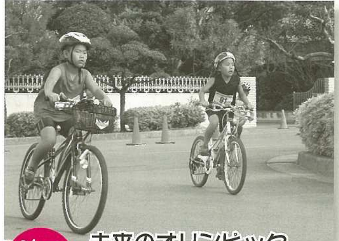
8/12 (日) 未来のオリンピック候補たち！

8月12日、石垣市中央運動公園をメイン会場に第16回石垣島ジュニア・トライアスロン大会（石垣市体育協会・石垣市教育委員会主催）が行われ272名の小・中学生トライアスリートが参加。参加した選手らは小さい体ながらもスイム、バイク、ランをこなしゴールを目指し、沿道では父母らの大声援が選手を後押ししていました！この中から第2の新城幸也選手が誕生することを期待しましょう！