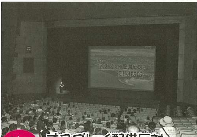
9/9 (日) オスプレイ配備反対 県民大会八重山大会

8月12日、石垣市中央運動公園をメイン会場に第16回石垣島ジュニア・トライアスロン大会（石垣市体育協会・石垣市教育委員会主催）が行われ272名の小・中学生トライアスリートが参加。参加した選手らは小さい体ながらもスイム、バイク、ランをこなしゴールを目指し、沿道では父母らの大声援が選手を後押ししていました！この中から第2の新城幸也選手が誕生することを期待しましょう！