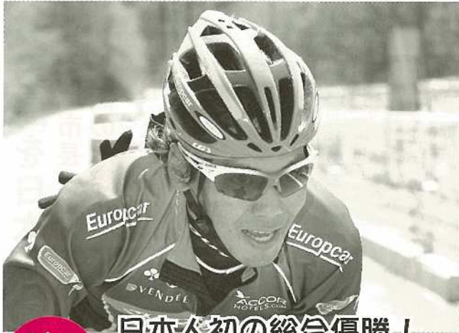
8/19 (日) 日本人初の総合優勝！ 新城幸也！

フランスで行われた自転車ロードレース「ツール・ド・リムザン」で石垣市出身の新城幸也選手が日本人としては初となる総合優勝を果たしました！ロンドンオリンピック出場に続く快挙に、地元自転車競技関係者も喜んでおり、自転車競技の普及拡大に期待しています！