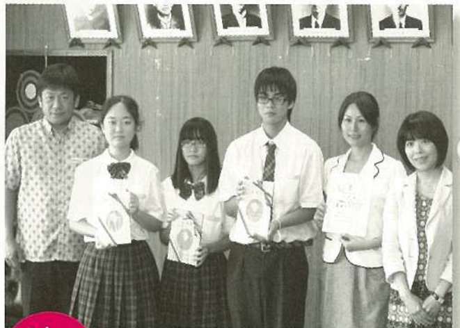
8/18 (土) 短歌甲子園で初出場準V

「オスプレイ配備に反対する沖縄県民大会八重山大会」が石垣市民会館大ホールで開かれ、約500名が参加。沖縄本島宜野湾海浜公園で開かれた県民大会の様様をスクリーンに映しパブリックビューイングを実施し、垂直離着陸輸送機MV22オスプレイの配備に反対への意志を表しました。