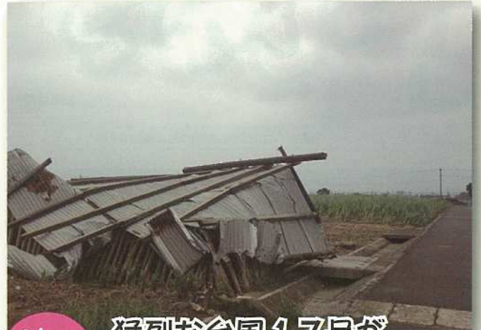
9/28 (金) 猛烈な台風17号が 石垣島地方に直撃！！

八重山の叙情歌「とうばらーま」を競う、とうばらーま大会が新栄公園で開かれ23人のうたしゃが情感を込めて歌い上げました。結果は市内登野城の新城喜亨さん(82)が最優秀賞に輝きました。台風の影響で延期になったにもかかわらず会場には大勢の市民が訪れ、満月の下「とうばらーま」に魅了されました。