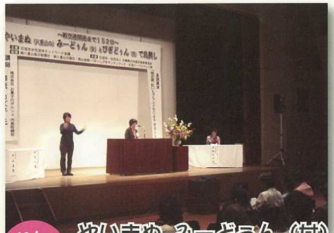
10/6 (日) やいまぬ みーどうん(女) とびぎどうん(男)で島興し

石垣市営陸上競技場で「第76回八重山郡陸上競技大会」が行われました。大正14年に始まり、今回で76回の歴史を持つこの陸上競技大会は八重山郡各地から14チーム、273名が参加し、地域の意地とプライドをかけた熱戦が繰り広げられ、白保が3連覇5回目の総合優勝を果たしました！