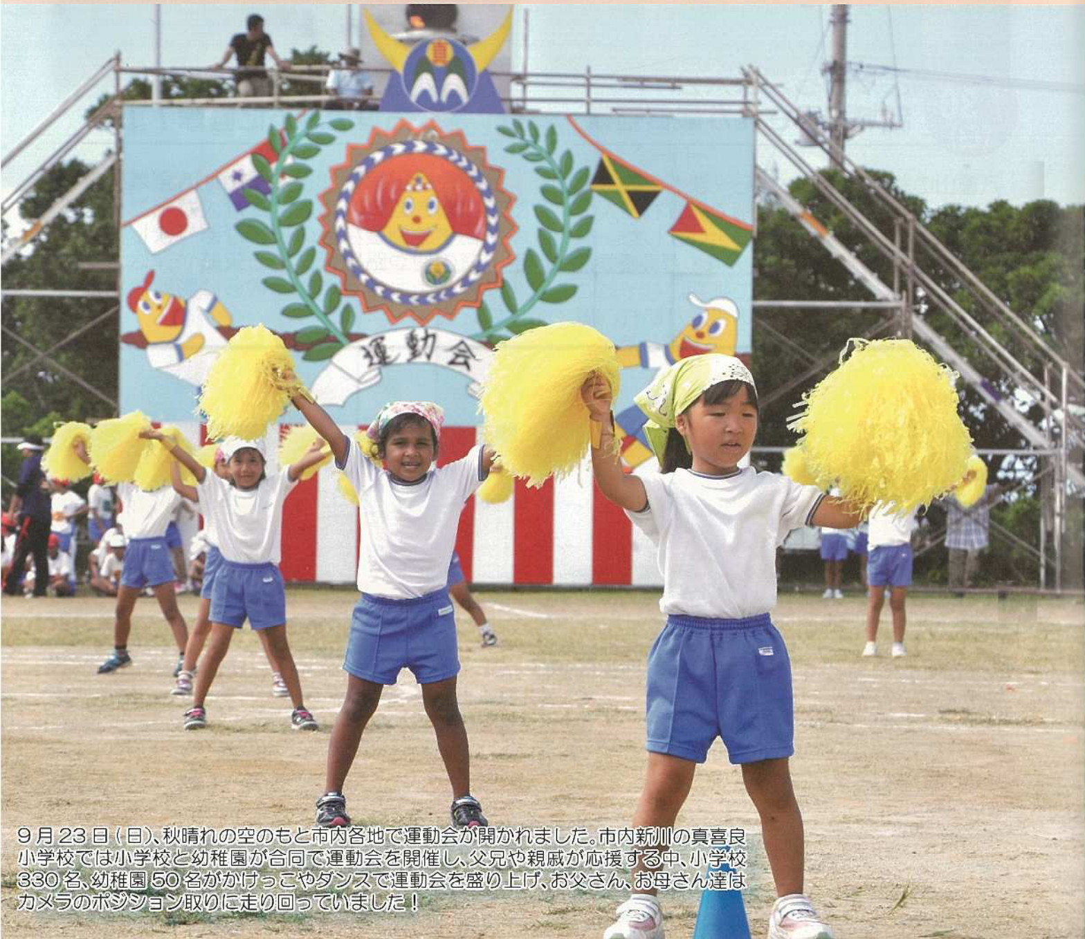
9月23日(日)、秋晴れの空のもと市内各地で運動会が開かれました。市内新川の真喜良小学校では小学校と幼稚園が合同で運動会を開催し、父兄や親戚が応援する中、小学校330名、幼稚園50名がかけっこやダンスで運動会を盛り上げ、お父さん、お母さん達はカメラのポジション取りに走り回っていました！