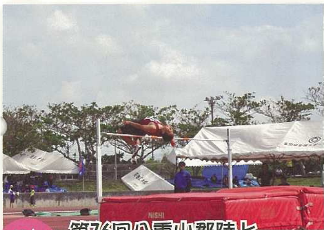
10/7 (日) 第76回八重山郡陸上 競技大会開催！

大型台風17号が28日八重山地方全域を暴風域に巻き込み、市内でけが人が出たり家屋や樹木の倒壊などの被害がありました。空・海の便や路線バスでも欠航や運休が相次ぐなど市民生活や観光客らに影響が出ました。