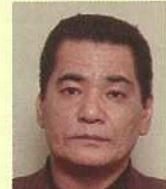
上地 恵栄 (56歳) 身長168cm位 殺人 (警視庁手配)