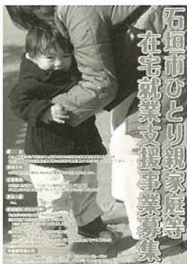
石垣市ひとり親家庭等在宅就業支援事業募集