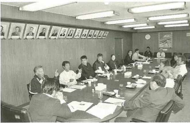
会員 港ターミナルの内覧会

中山市長 闘牛が盛り上がってくれば、闘牛をやりたいという人が増えて闘牛自体の数も増えるんじゃないですか。