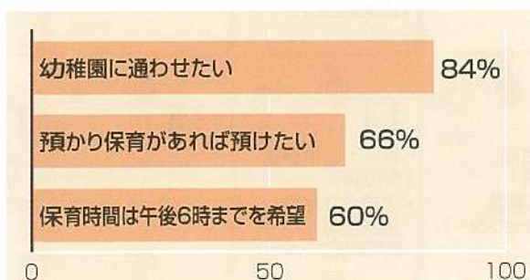
市幼稚園教育振興に関する実態調査結果より抜粋

「平成19年6月の学校教育法の一部改正により、地域の実態や保護者の要請により、教育課程に係る教育時間の終了後等に希望する者を対象に行う教育活動である「預かり保育」が幼稚園教育要領に示されました。」石垣市の現状を見ると両親共働きで午後からの保育を必要とする幼児が増加傾向にあります。また、預かり保育を希望する保護者が7割近くに達し、そのことから市街地における預かり保育実施園の拡大が必要と考えます。