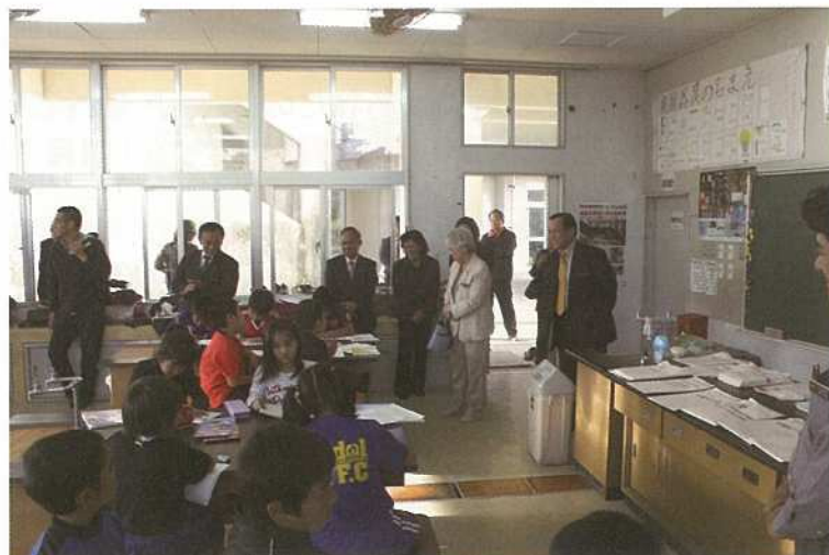
【教育委員、社会教育委員合同による視察】

和気あいあいの中に、子どもたちは自分の課題に取り組み、父母の皆さんがそっと見守っている姿がとても印象的でした。