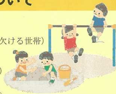
各保育所(園)新規入所(園)人数(見込み)