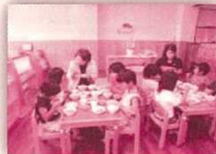
（なごみの広場保育園保育参観）