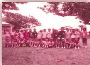
（まきら幼&まきら保育園）