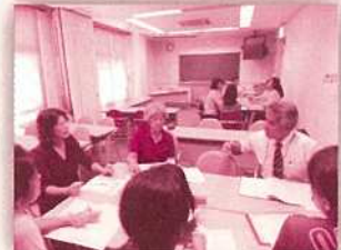
（第1回各校区内にて協議）