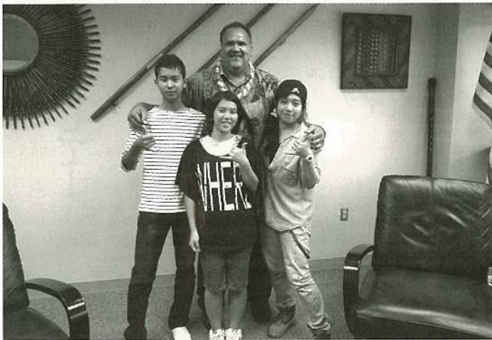
カウアイ市長と記念撮影！

3名の派遣生徒は、カウアイ出発前、不安でいっぱい表情でしたが、学校の温かい歓迎を受け、また現地生徒との交流、ホストファミリーとの生活等、様々な経験をとおり、生徒の表情が自信に満ち溢れ、積極的に明るく行動をとるようになりました。カウアイ高校では、生徒たちと交流し、英語による授業も体験しました。3名はそれぞれのクラスでスピーチを披露し、事前研修で準備をしていた石垣島の紹介プレゼンテーションや安里屋ユンタ、まみどーまの踊りを披露するなど、地元の高校生との交流を深めました。