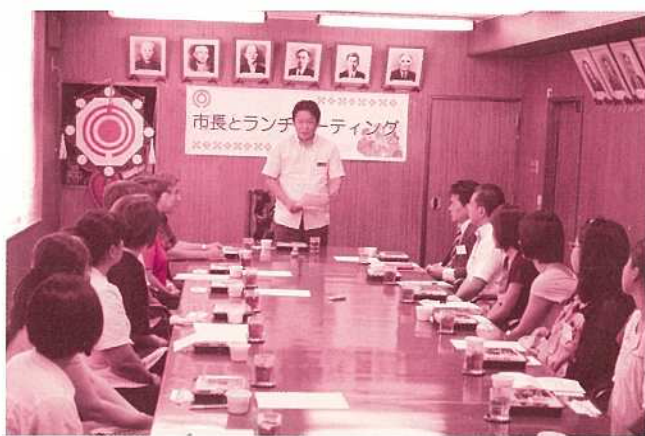
団員 音楽をやりたいけど演奏

くいて素晴らしい仲間が多くメンバーとして加わってくれました。メンバーみんな音楽が心から好きで、日曜の夕方から集まって楽しく練習をしています。その活動の中で、我々だけではないのですが、市内で音楽をやっている人たちは練習場所を確保するのが大変なんです。私たちはこれから石垣市に貢献できる吹奏楽団として頑張っていけますので練習場所を提供していただければと考えています。