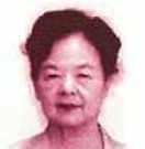
新城トヨ ☎82-3537 新栄町中