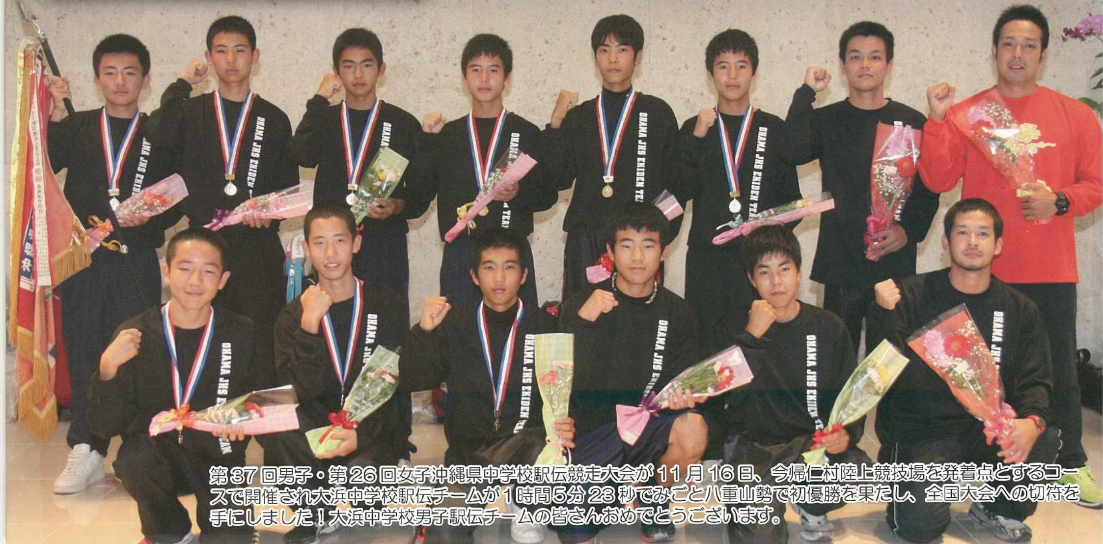
第37回男子・第26回女子沖縄県中学校駅伝競走大会が11月16日、今帰仁村陸上競技場を発着点とするコースで開催され大浜中学校駅伝チームが1時間5分23秒でみごと八重山勢で初優勝を果たし、全国大会への切符を手に入れました！大浜中学校男子駅伝チームの皆さんおめでとうございます。

石垣市フェイスブックページ https://www.facebook.com/city.ishigaki/