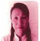
西玉得みどり ☎83-2510 新栄町東