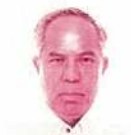
半嶺当永 ☎86-8138 宮良(南) 宮良団地含む