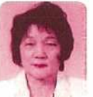
下地房子 ☎83-0340 大川4町内東