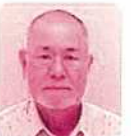
裁 里秋 ☎82-8396 新川双葉南