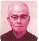
東宇里永清 ☎83-5589 平得(上)