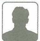
①氏名 ②電話番号 ③担当地区