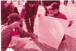
昨年の審査の様子

※市販の凧については審査の対象ではありませんが、決められたエリアでの凧揚げができます。