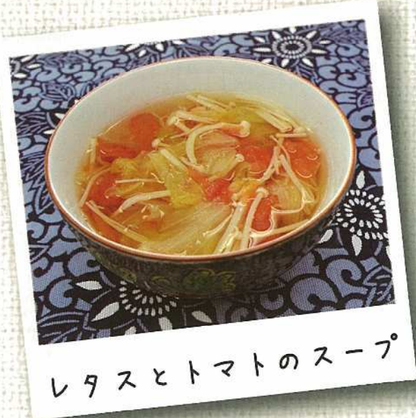
レタスとトマトのスープ

エネルギー 23kcal たんぱく質 1.9g 脂質 0.3g カルシウム 13mg 鉄 0.4mg 塩分 1.0g