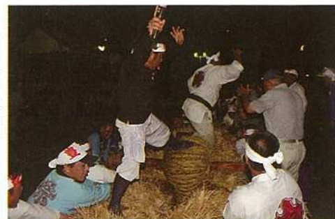
▲ 7月13日に行われた大浜村の豊年祭。旗頭の奉納、太鼓の奉納や弥勒奉納、各団体の余興行列が披露され、クライマックスは来場者全員での大綱引きが行われました。