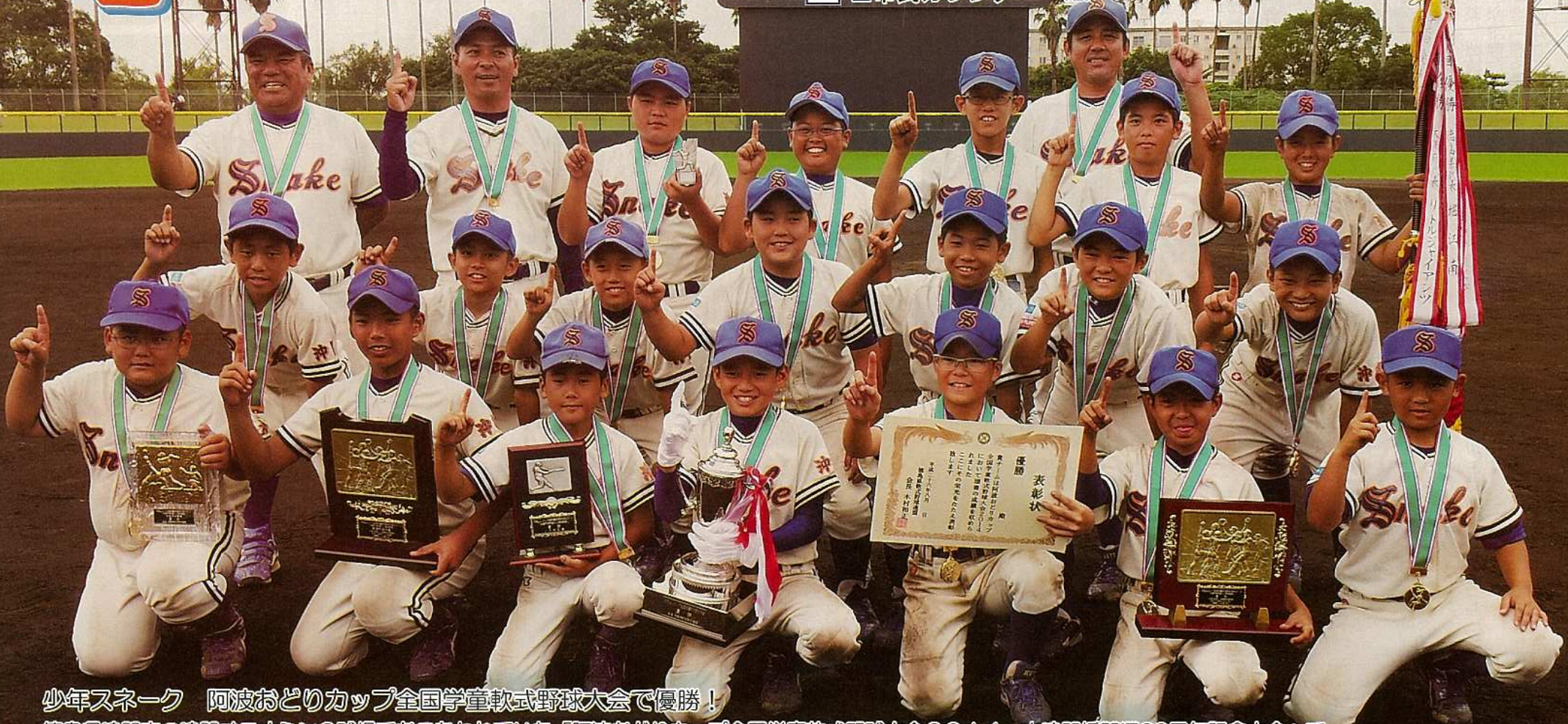
少年スネーク 阿波おどりカップ全国学童軟式野球大会で優勝！ 徳島県鳴門市の鳴門オロナミンC球場でおこなわれていた「阿波おどりカップ全国学童軟式野球大会2014・大鳴門橋開通30周年記念大会」で沖縄県代表として出場していた少年スネークが見事に優勝を飾りました！決勝では宮崎県代表の三股ブルースカイと対戦し6-2で快勝し、全国の頂点に立ちました。少年スネークのみなさんおめでとうございます！