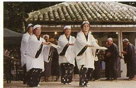
▲ 7月23日に新川にある真乙姥御嶽に四カ字が集結。台風10号が接近し強風が吹く中、御嶽前の道路には各字や団体の旗頭が勢ぞろいし、女性たちによるアヒャー綱、ツナヌミン、大綱引きと続き、会場は豊年祭独特の熱気に包まれました。