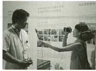
現地メディアの取材を受ける市長

また、市観光文化課が進めている「UIDESIGNPROJECT」として、石垣島での玄米乳を実際に会場で作って、訪れたお客さんに製造過程も伝えながら味わっていただくというワークショップも実施し、初めての玄米乳に現地の方は戸惑いながらも、口に含めた瞬間の反応はとも良、成功裏に終える事が出来て、最後には参加全員で笑顔で締めくくられました。