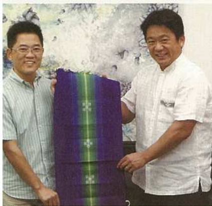
中山 義隆 石垣市長 黄 健庭 台東県知事

今回のエキスポでは、8月8日から10日までを「石垣祭」として特別企画を実施し、中山義隆石垣市長と黄健庭台東県知事とで面談をおこない、今後の様々な交流の可能性を話し合ったり、通常の出展ブース以外でも、石垣島に縁のあるクリエイターらがワークショップやライブパフォーマンスをおこない、石垣市の文化やアート、デザイン等を全面的にPRしてきました。