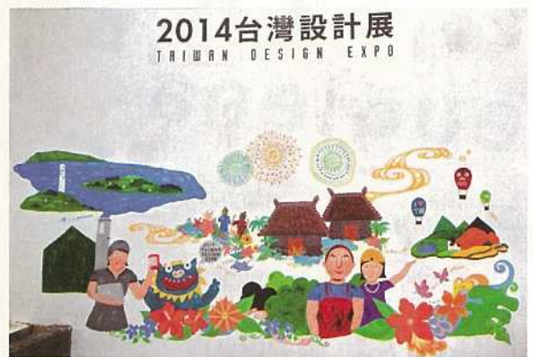
Pokke104 と台湾の作家 NIC との合作 (エキスポ展示会場の壁面)

「石垣祭」初日である8月8日午後、台東県庁にておこなわれた石垣市長と台東県知事との面談では、石垣市長が「石垣市を含む八重山圏域と台東県を含む台湾東海岸の交流をもっと活発にしていきたい」と、八重山と台湾東海岸地域との交流に決意を示しました。 また、「台東と石垣島は伝統文化も色濃く残っており、似ているところが沢山あることに気が付いた。今後、デザインやアートなど、これまでの交流事業とは違った新しい交流にも期待している。」等、今後の石垣市と台東との関係性にこれまでとは違った新たな試みやアプローチについて意欲的に台東県知事と話し合いました。