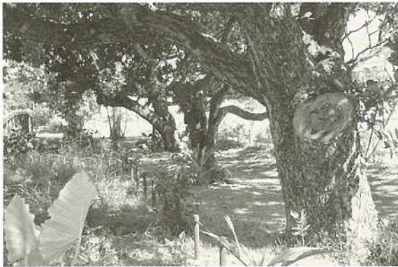
宮良浜川原のヤラブ並木（9月26日付追加指定） 石垣市指定文化財の指定・認定・選定及び選択基準 第6市指定史跡名勝天然記念物指定基準 3天然記念物 (2) 植物

石垣市指定文化財として、新たに2件が加わりました。私たちの祖先が守り伝えてきた大切な文化財を後世に残すには、皆さまのご協力が不可欠です。今後とも文化財保護の活動に、ご理解とご協力を賜りますようお願いいたします。 石垣市教育委員会文化財課 電話：83-7269