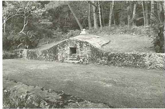
長田家の古墓（10月27日付指定） 石垣市文化財の指定・認定・選定及び選択基準 第1市指定有形文化財指定基準 7建造物の部 (4) 学術的価値の高いもの