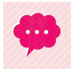
はっきり嫌だと言われなくても