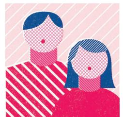
結婚していても、恋人同士でも