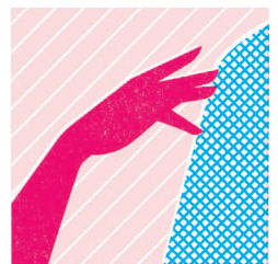
ボディータッチされても