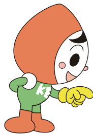
人権イメージキャラクター 人KENまる君