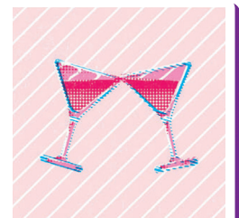
二人きりで食事しても