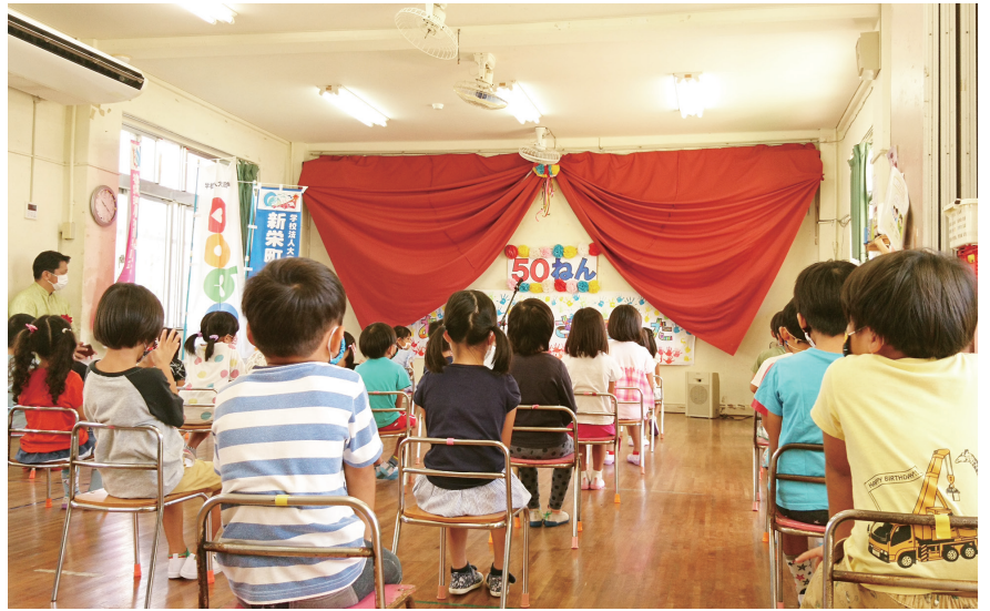
8月6日(木)お別れ会の様子

https://www.isg-shineicho.ed.jp/tatekae.php