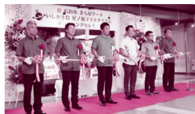
プラネタリウムオープン