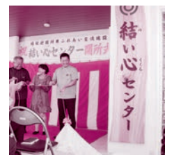
結い心センター開所