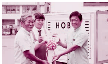
移動販売車 HOBOS 出発式