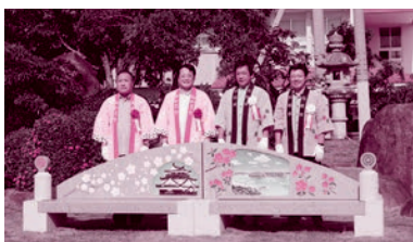
岡崎市より石製ベンチ寄贈